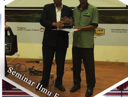
Seminar Ilmu Falak