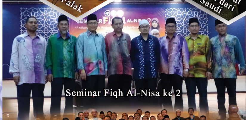
Seminar Fiqh Al-Nisa ke 2