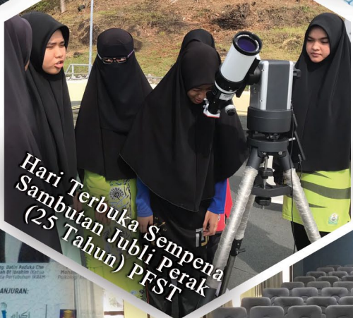
Hari Terbuka Sempena Sambutan Jubli Perak (25 Tahun) PFST