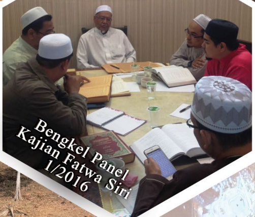
Bengkel Panel Kajian Fatwa Siri 1/2016