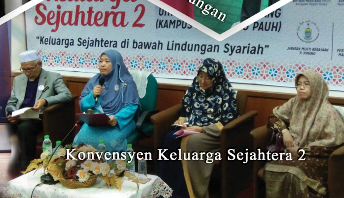
Konvensyen Keluarga Sejahtera 2