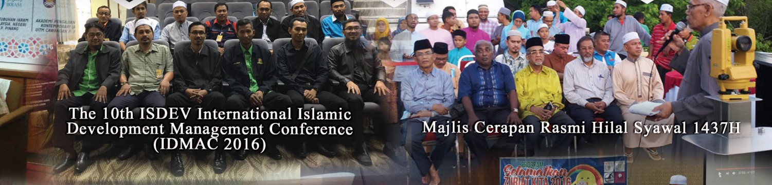
The 10th ISDEV International Islamic Development Management Conference (IDMAC 2016)