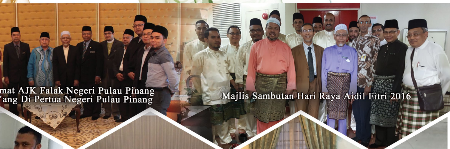
mat AJK Falak Negeri Pulau Pinang yang Di Pertua Negeri Pulau Pinang