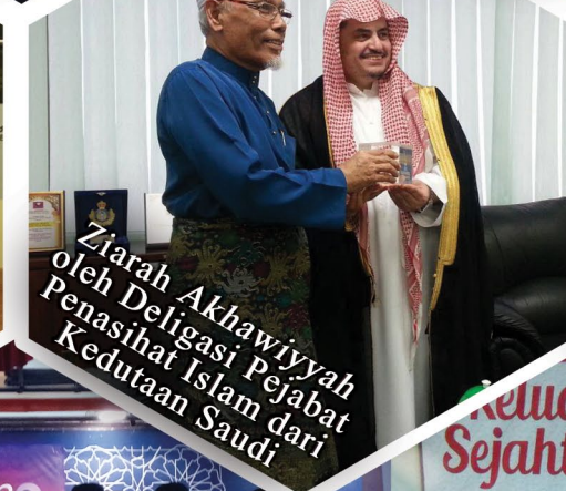
Ziarah Akhawiyyah oleh Deligasi Pejabat Penasihat Islam dari Kedutaan Saudi