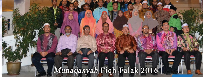
Munaqasyah Fiqh Falak 2016