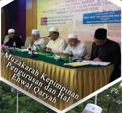
Muzakarah Kepimpinan Pengurusan dan Hal Ehwal Qaryah