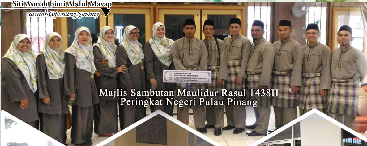
Majlis Sambutan Maulidur Rasul 1438H Peringkat Negeri Pulau Pinang