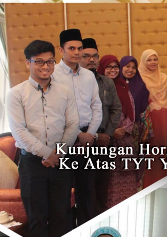
Kunjungan Hor Ke Atas TYT Y