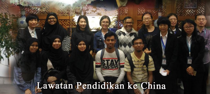
Lawatan Pendidikan ke China