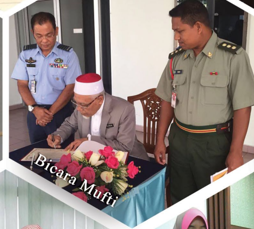
Lawatan Sambil Belajar ke PFST