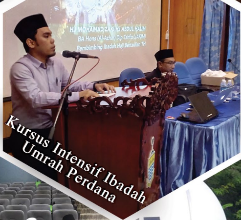
Kursus Intensif Ibadah Umrah Perdana