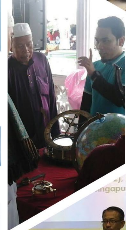
Kuliah Umum Siri 4/2016