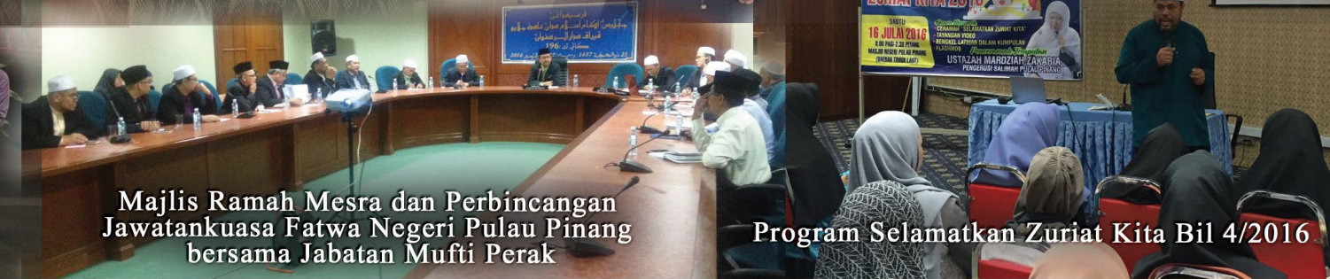
Majlis Ramah Mesra dan Perbincangan Jawatankuasa Fatwa Negeri Pulau Pinang bersama Jabatan Mufti Perak