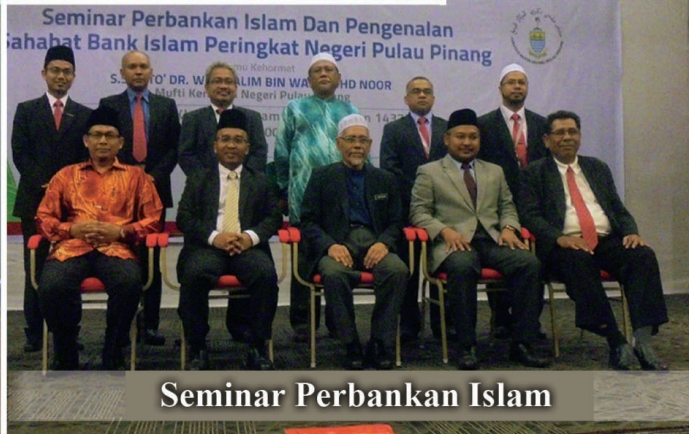
Seminar Perbankan Islam