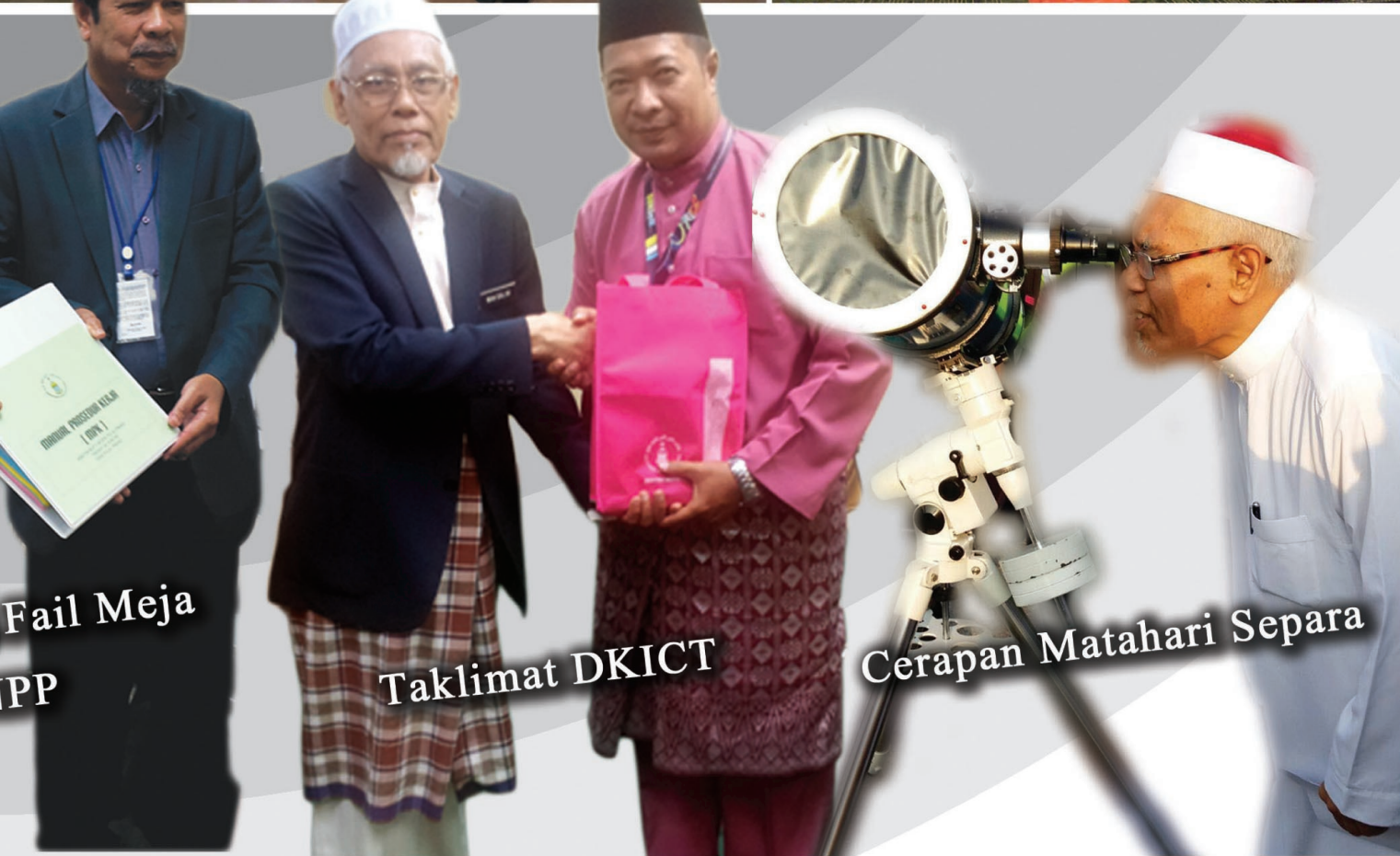
Fail Meja PP