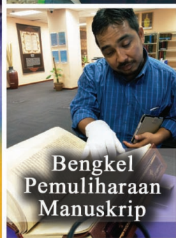
Bengkel Pemuliharaan Manuskrip