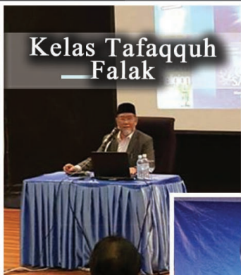
Kelas Tafaqquh — Falak