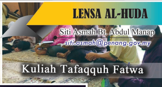
Kuliah Tafaqquh Fatwa