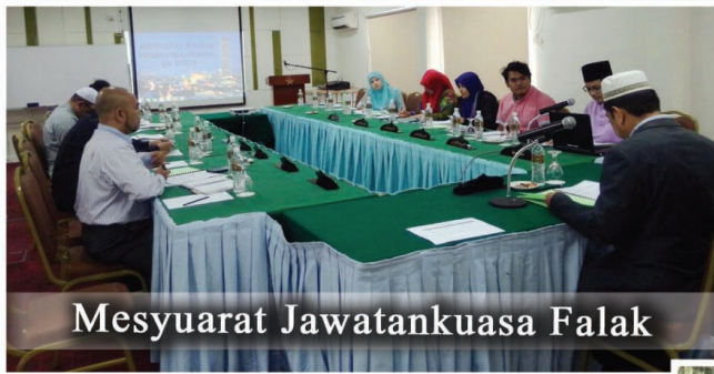
Mesyuarat Jawatankuasa Falak