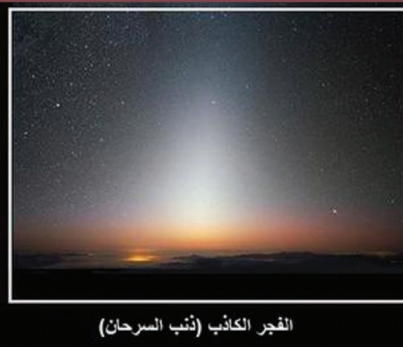
الفجر الكاذب (نُتِبَ السرحان)