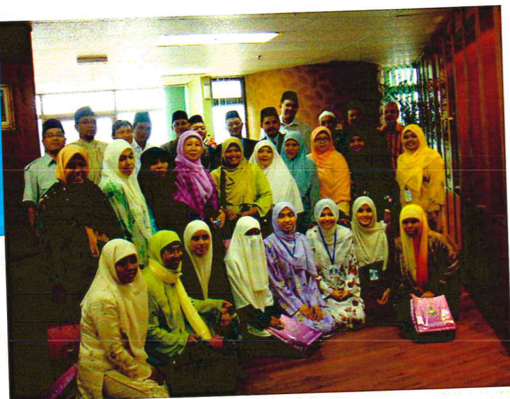
Lawatan daripada Mitra Sejati Perempuan Indonesia (MISPI) dan Majelis Permusyawaratan Ulama (MPU) Provinsi Nanggroe Aceh Darussalam ke Jabatan Mufti