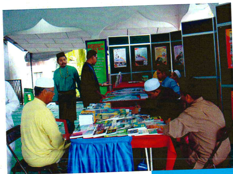
Salah satu aktiviti dalam program bersiri sehari bersama JMPP.