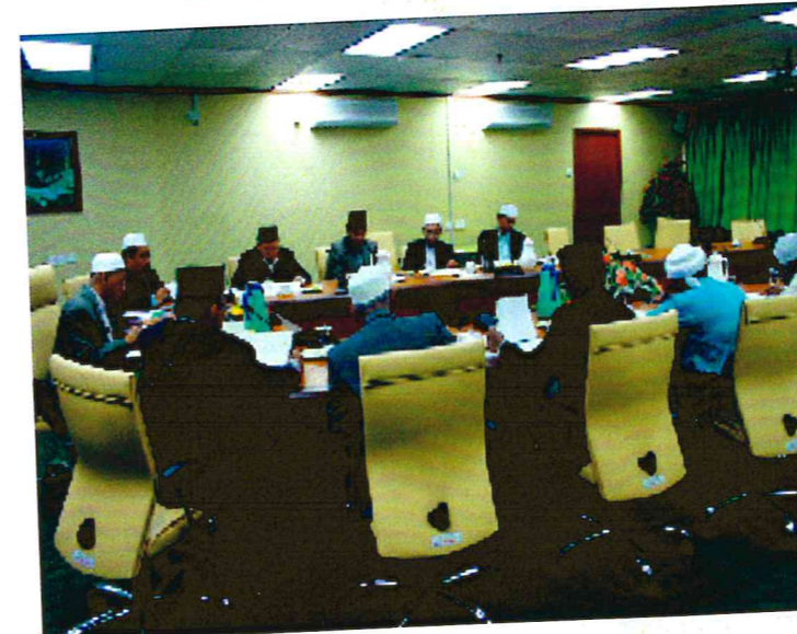
Mesyuarat Jawatan Kuasa Fatwa Negeri Pulau Pinang