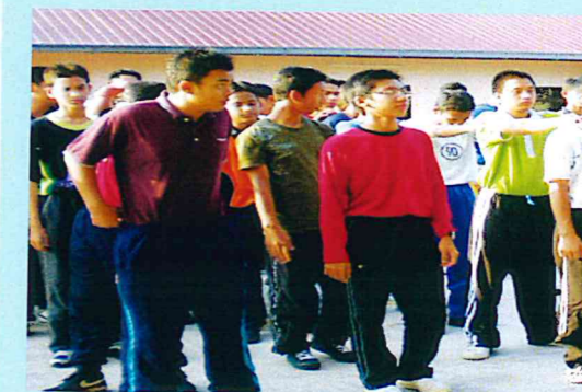
Taklimat Peta Bintang, Falak Amazing Race, Kuiz dan program Rempuh Halangan.