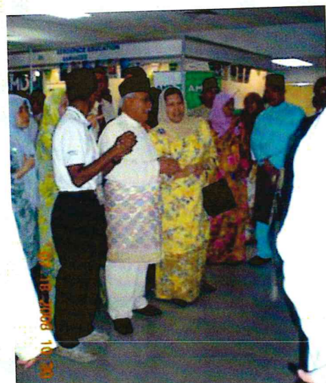
Lawatan TYT ke booth pameran sempena Konvensyen Astronomi USM 2009