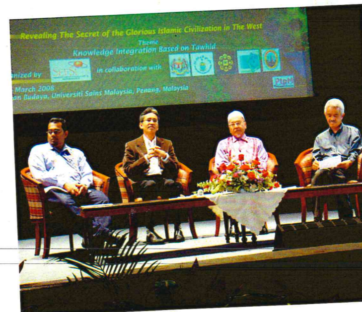
Majlis Perasmian Penutup Seminar Antarabangsa Andalusia 1300 Masehi