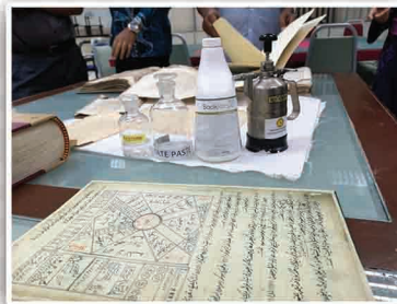
Bahan-Bahan Bagi Pemuliharaan Manuskrip