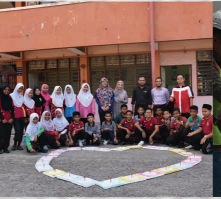
Bengkel Falak (Tongkat Istiwa) Sekolah Kebangsaan Bayan Lepas, Pulau Pinang 5 September 2018