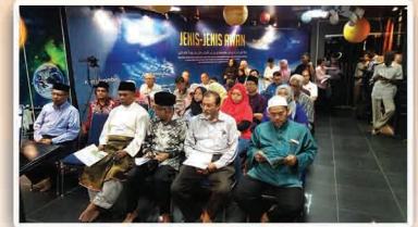
AJK Rukyah dan para pengunjung mendengar Taklimat Cerapan Hilal Syawal 1439H