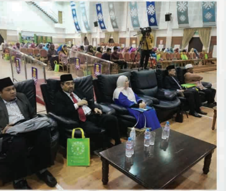
Seminar Hukum Islam Semasa 2018: Ikhtilaf Dalam Kerjaya Dewan Besar,UiTM Cawangan Pulau Pinang 7 Ogos 2018