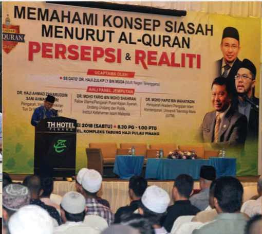
Seminar Al-Quran Peringkat Negeri Pulau Pinang TH Hotel, Bayan Lepas, Pulau Pinang 12 Mei 2018