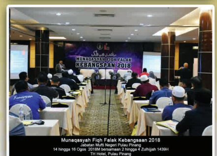
Munaqasyah Fiqh Falak Kebangsaan 2018 Jabatan Mufti Negeri Pulau Pinang 14 hingga 16 Ogos 2018M bersamaan 2 hingga 4 Zulhijjah 1439H TH Hotel, Pulau Pinang