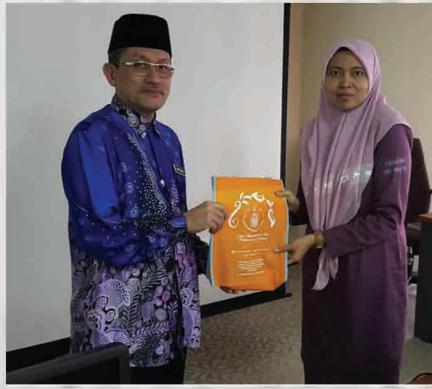
Bengkel Sistem Aplikasi myPunch, STEP dan Sistem Keratan Akhbar Bilik Latihan ICT (Millenium), KOMTAR 9 Ogos 2018