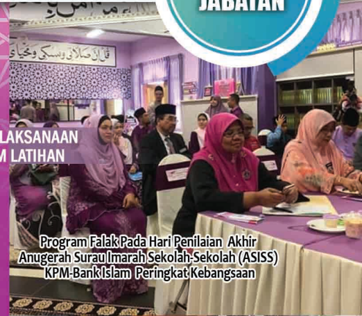
Program Falak Pada Hari Penilaian Akhir Anugerah Surau Imarah Sekolah-Sekolah (ASISS) KPM-Bank Islam Peringkat Kebangsaan

BENGKEL FALAK (TONGKAT ISTIWA) Lokasi : Sekolah Kebangsaan Bayan Lepas, Pulau Pinang