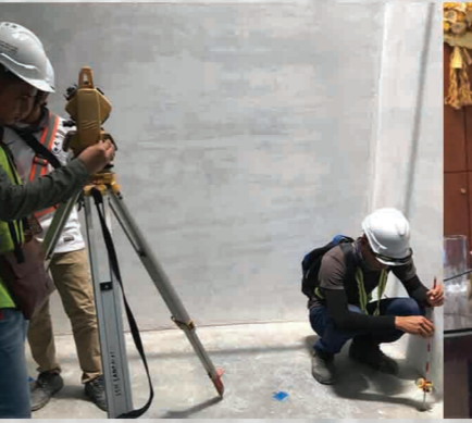
Penentuan & Pengesahan Arah Kiblat Tapak Surau IKEA Batu Kawan, Pulau Pinang 20 September 2018