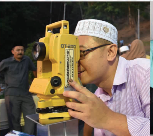
Majlis Cerapan Hilal Rasmi Ramadan 1439H Pusat Falak Sheikh Tahir, Pulau Pinang. 15 Mei 2018