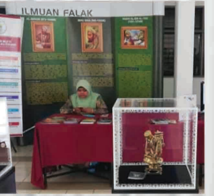
Booth pameranJMNPP: Karnival Check-in Masjid Pusat Islam, UiTM Pulau Pinang 2 - 4 Oktober 2018