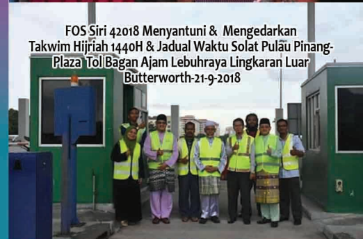
FOS Siri 42018 Menyantuni & Mengedarkan Takwim Hijriah 1440H & Jadual Waktu Solat Pulau Pinang-Plaza Tol Bagan Ajam Lebuhraya Lingkaran Luar Butterworth-21-9-2018