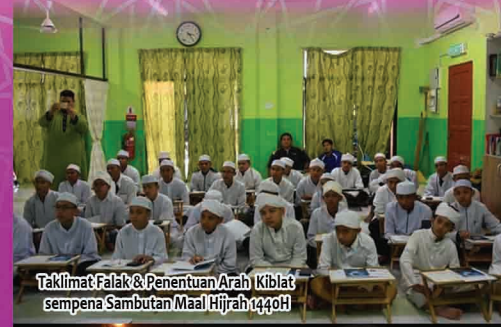
Taklimat Falak & Penentuan Arah Kiblat sempena Sambutan Maal Hijrah 1440H