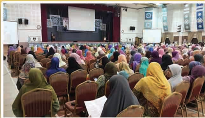
Peserta Seminar Hukum Islam-Ikhtilat