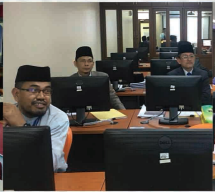
Bengkel Sistem eFatwa Bilik Latihan ICT (Siber), KOMTAR 3 Julai 2018