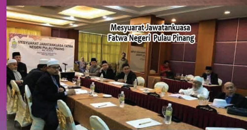
Mesyuarat Jawatankuasa Fatwa Negeri Pulau Pinang