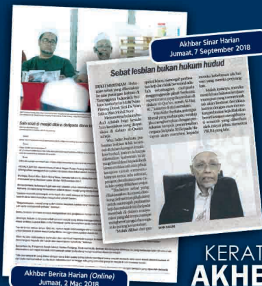
Akhbar Berita Harian (Online) Jumaat, 2 Mac 2018