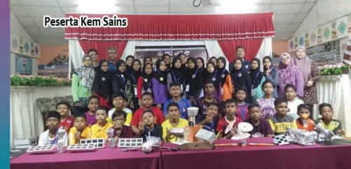
Peserta Kem Sains