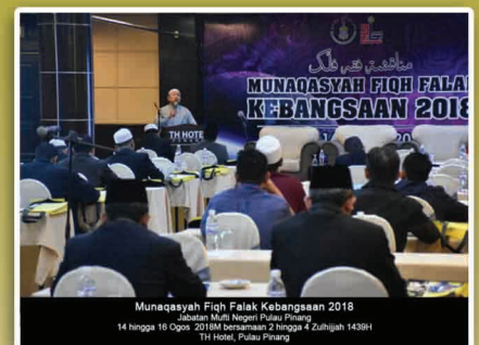
Munaqasyah Fiqh Falak Kebangsaan 2018 Jabatan Mufti Negeri Pulau Pinang 14 hingga 16 Ogos 2018M bersamaan 2 hingga 4 Zulhijjah 1439H TH Hotel, Pulau Pinang

Sepuluh (10) resolusi telah dirumuskan sebagai tindakan susulan hasil dari Munaqasyah yang diadakan. Majlis Penutup Munaqasyah disempurnakan oleh Tuan Hj. Aziz bin Mohamad, Pengarah Bahagian Penyelarasan Undang-undang dari JAKIM mewakili Ketua Pengarah JAKIM.