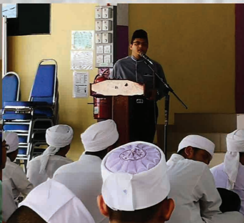
Program Kem Falak Junior 2018 Pusat Kokurikulum Pulau Pinang 15 - 16 Oktober 2018