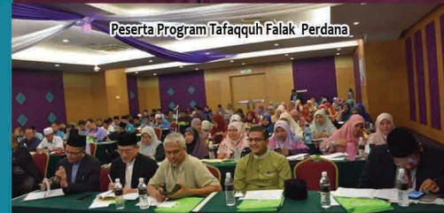
Peserta Program Tafalahu Falak Perdana