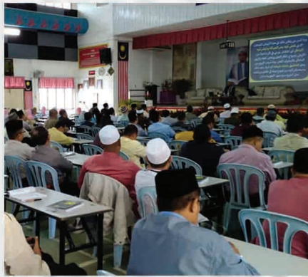
Daurah Kitab Sifat 20 SMK Sri Muda, Penaga, SPU 25 - 26 Jun 2018