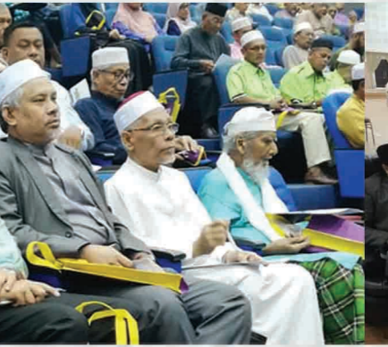
Muzakarah Kepimpinan Pengurusan Masjid dan Hal Ehwal Kariah 2018 Peringkat Negeri Pulau Pinang Inst. Latihan Perindustrian, Kepala Batas 28 Julai 2018