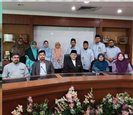
Bengkel Pengaplikasian Media Elektronik dalam Penyebaran Irsyad Hukum dan Fatwa Jabatan Mufti Negeri Selangor 7 November 2018