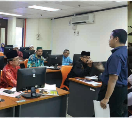
Bengkel Penulisan 2018 Bilik Latihan ICT (Siber), KOMTAR 12 Julai 2018