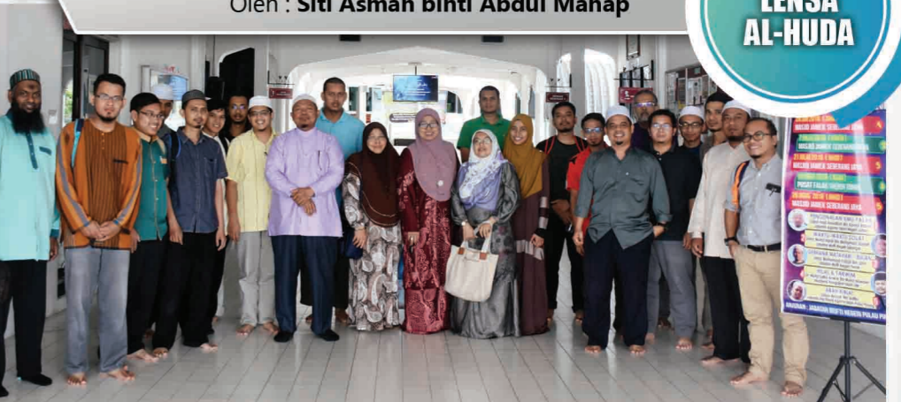
Modul 1 - Siri Pengajian Sijil Asas Falak Pulau Pinang 2018 (Modul 1: Pengenalan Ilmu Falak) Majid Jamek Seberang Jaya, Pulau Pinang. 24 Jun 2018