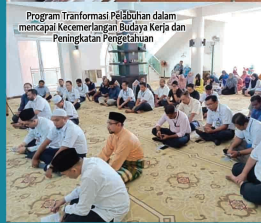
Program Tranformasi Pelabuhan dalam mencapai Kecemerlangan Budaya Kerja dan Peningkatan Pengetahuan