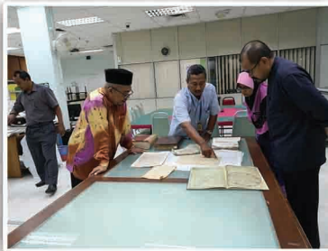
Penerangan Proses - Kaedah Pemuliharaan Manuskrip

Arkib Negara Malaysia juga bersedia untuk membantu Jabatan Mufti Negeri Pulau Pinang dari pelbagai sudut dalam proses pemuliharaan manuskrip ini agar bahan tersebut tidak pupus dan hilang. Jalinan kerjasama antara kedua-dua Jabatan ini mungkin boleh diwujudkan dalam usaha ke arah mencapai matlamat tersebut.