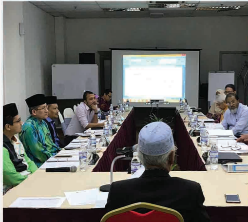
Mesyuarat Jawatankuasa Falak Negeri Pulau Pinang Bil.1/2018 TH Hotel, Bayan Lepas, Pulau Pinang 3 Mei 2018