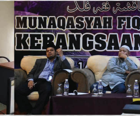
Munaqasyah Fiqh Falak Kebangsaan 2018 TH Hotel, Pulau Pinang 14 - 16 Ogos 2018