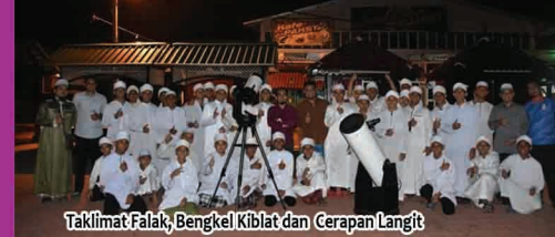
Taklimat Falak, Bengkel Kiblat dan Cerapan Langit