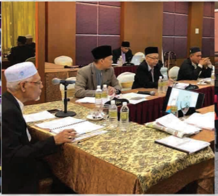
Mesyuarat Jawatankuasa Fatwa Negeri Pulau Pinang Bil. 4/2018 Pen Mutiara Hotel & Restoran, Batu Maung 29 dan 30 Ogos 2018