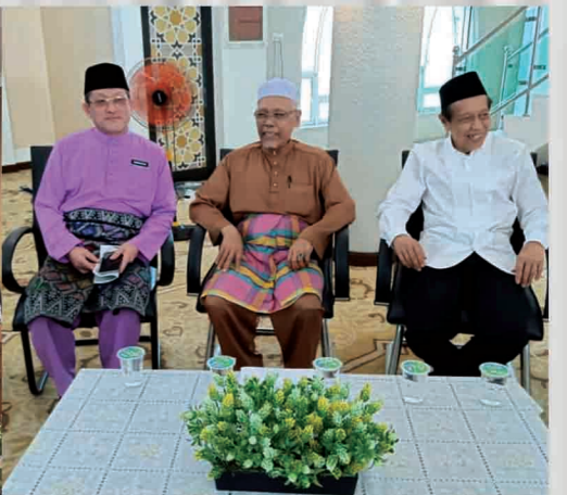
Majlis Penyempurnaan Kajian & Penyerahan Modul Latihan & Bimbingan Pelaksanaan Ibadat Solat Untuk Operator Kren Surau Terapung, Penang Port, Butterworth 30 November 2018