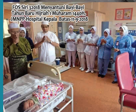
FOS Siri 32018 Menyantuni Bayi-Bayi Tahun Baru Hijriah 1 Muharam 1440H. JMNPP-Hospital Kepala Batas-11-9-2018