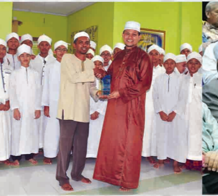
Program Falak On The Street (FOS) Siri 1/2018 Pusat Kecemerlangan As-Syafie, Kepala Batas 16 Julai 2018