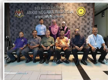
Kakitangan Jabatan Mufti Negeri Pulau Pinang Bergambar Bersama Kakitangan Arkib Negara Malaysia