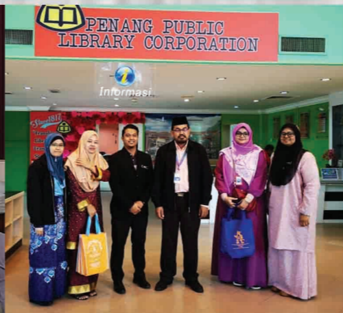
Lawatan oleh kakitangan Jabatan Mufti Negeri Pulau Pinang Perpustakaan Negeri Pulau Pinang di Seberang Jaya 16 Oktober 2018