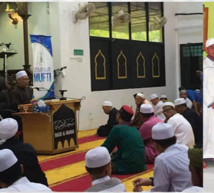
Program Mimbar Mufti Masjid Al-Ihsaniah, Simpang Empat, Pulau Pinang 13 Julai 2018