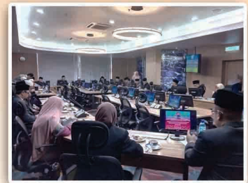
Pertemuan dengan Ahli Jawatankuasa Fatwa Negeri Johor