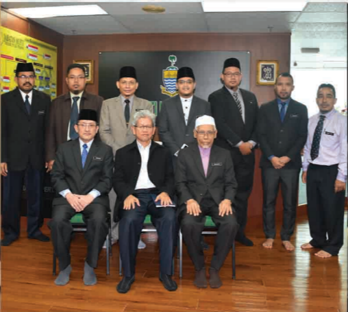
Majlis Bersama TKM 1 Y.B Dato' Ir. Haji Ahmad Zakiyuddin bin Abdul Rahman merangkap Pengerusi Jawatankuasa Hal Ehwal Agama Islam, Pembangunan Industri dan Perhubungan Masyarakat Negeri Pulau Pinang ke Jabatan Mufti Negeri Pulau Pinang. 4 Jun 2018