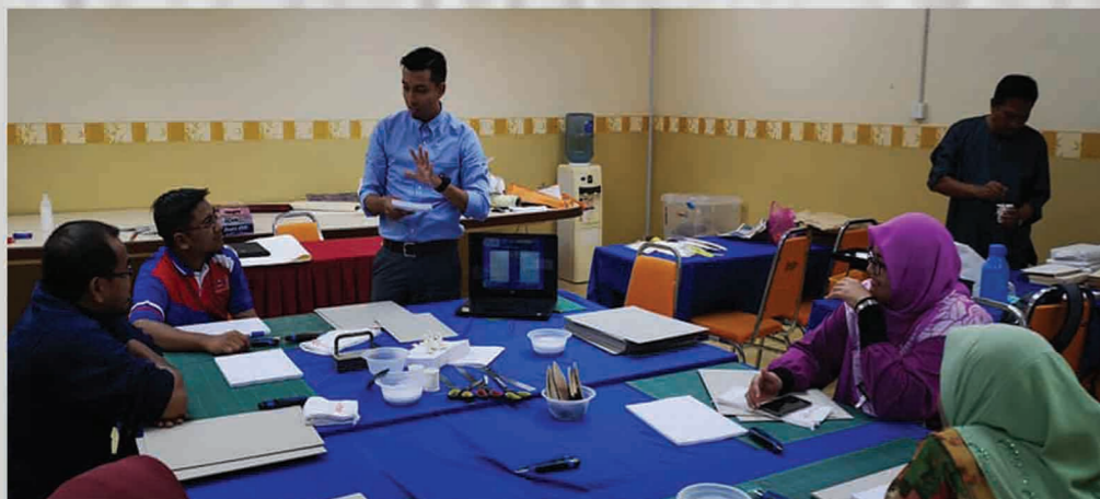
Bengkel Kerja Pemuliharaan Manuskrip Zon Utara Dewan Sri Pinang, Pulau Pinang 8 - 10 Oktober 2018