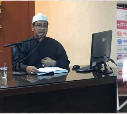
Daurah Kitab Al Ashbah wa An Nazhoir Pusat Islam, UiTM Pulau Pinang 26 - 27 September 2018