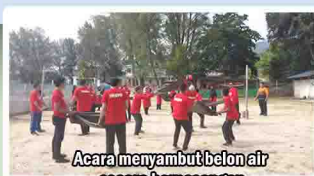
Acara menyambut belon air secara berpasangan