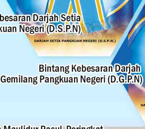
Bintang Kebesaran Darjah Setia Pangkuan Negeri (D.S.P.N)

2. Dianugerahkan Bintang Kebesaran Darjah Setia Pangkuan Negeri (D.S.P.N) oleh Kerajaan Negeri Pulau Pinang pada 10 Julai 1999.