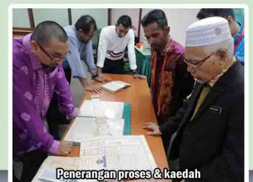
Penerangan proses & kaedah pemeliharaan manuskrip