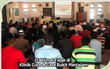
Taklimat Falak di Klinik Cure & Care Bukit Mertajam