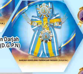
Bintang Kebesaran Darjah Gemilang Pangkuan Negeri (D.G.P.N)

3. Dianugerahkan Pingat Panglima Jasa Negara (P.J.N.) oleh DYMM Seri Paduka Baginda Yang di-Pertuan Agong pada tahun 2008.