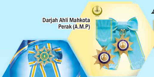
Darjah Ahli Mahkota Perak (A.M.P)

1. Dianugerahkan Bintang Kebesaran Darjah Ahli Mahkota Perak (A.M.P) oleh Kerajaan Negeri Perak pada tahun 1990.