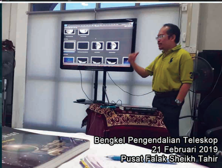
Bengkel Pengendalian Teleskop 21 Februari 2019 Pusat Falak Sheikh Tahir