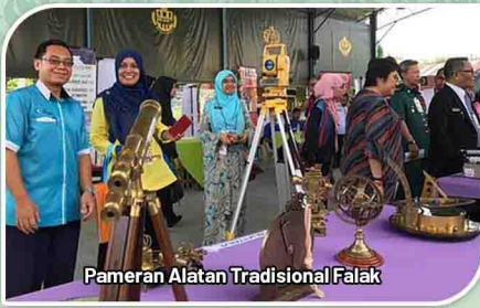
Pameran Alatan Tradisional Falak