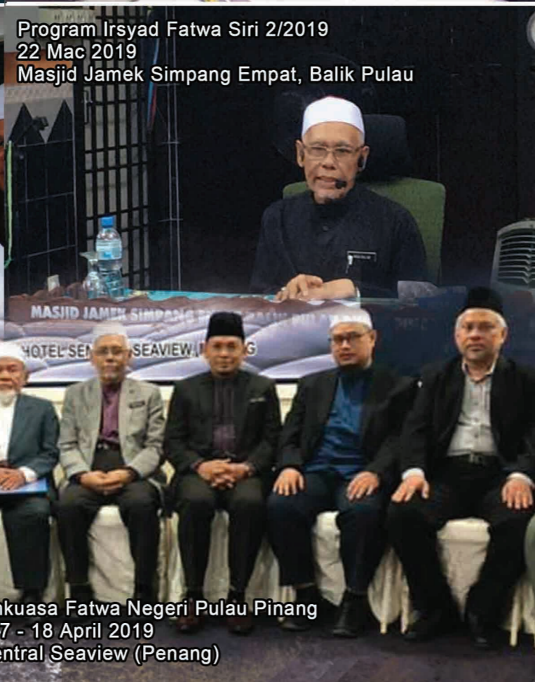
Program Irsyad Fatwa Siri 2/2019 22 Mac 2019 Masjid Jamek Simpang Empat, Balik Pulau