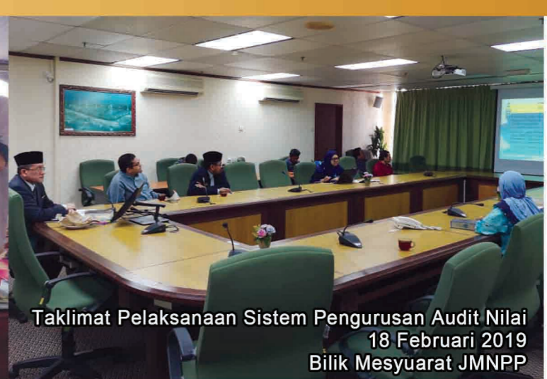
Taklimat Pelaksanaan Sistem Pengurusan Audit Nilai 18 Februari 2019 Bilik Mesyuarat JMNPP