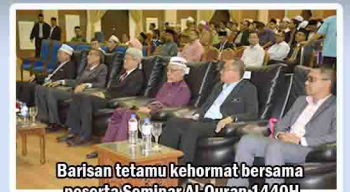
Barisan tetamu kehormat bersama peserta Seminar Al-Quran 1440H

Seminar Al-Quran Peringkat Negeri Pulau Pinang yang berlangsung pada 23 April 2019 itu, bermatlamat untuk membahaskan pelbagai kaedah dan perspektif Maqasid as-Syariah berdasarkan kerangka al-Quran dalam pentadbiran sesebuah negara.