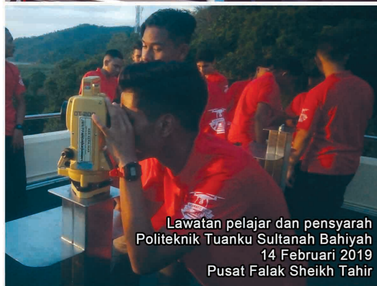
Lawatan pelajar dan pensyarah Politeknik Tuanku Sultanah Bahiyah 14 Februari 2019 Pusat Falak Sheikh Tahir