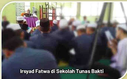
Irsyad Fatwa di Sekolah Tunas Bakti