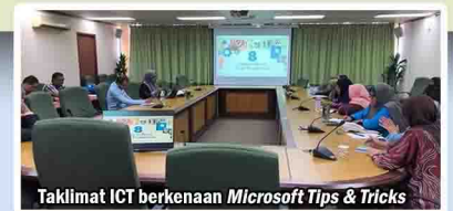
Taklimat ICT berkenaan Microsoft Tips & Tricks

Bengkel ICT yang telah berlangsung pada 8 April 2019 itu, bermatlamat untuk memantapkan pembudayaan ICT dikalangan warga kerja Jabatan ini dan untuk mengoptimalkan penggunaan teknologi ICT dalam menyahut seruan pelaksanaan Kerajaan Digital oleh Kerajaan Negeri Pulau Pinang.