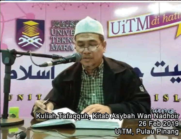
Kuliah Tafaqquh, Kitab Asybah Wan Nadhoir 26 Feb 2019 UiTM, Pulau Pinang