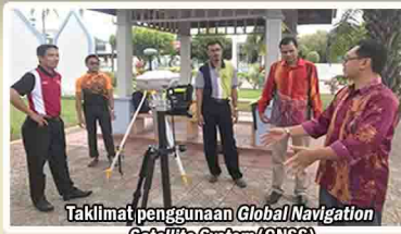
Taklimat penggunaan Global Navigation Satellite System (GNSS)