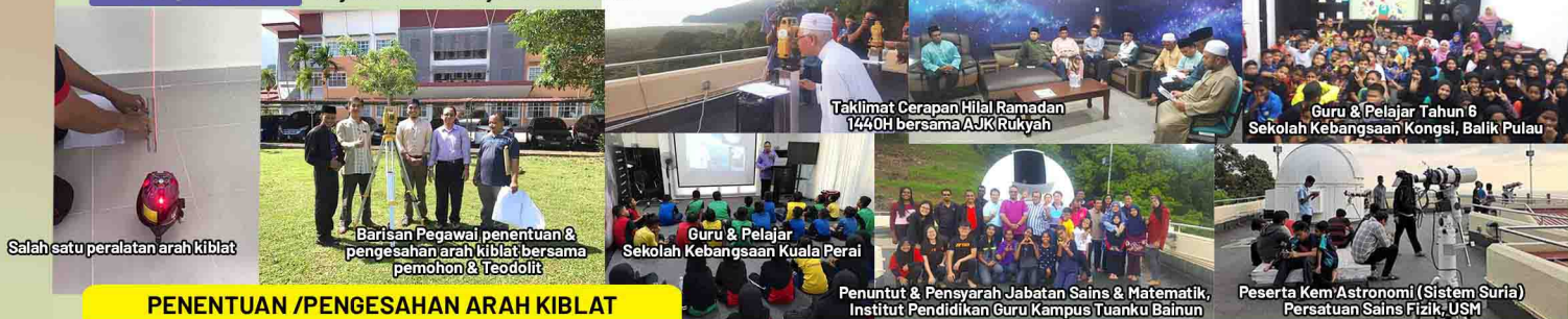
Salah satu peralatan arah kiblat