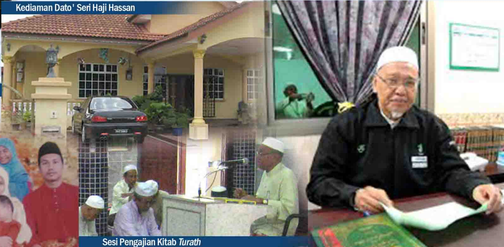
Sesi Pengajian Kitab Turath

Bagaimanakah corak pendidikan, gaya kehidupan dan penerapan pemikiran ibu bapa Y.Bhg. Dato' Seri kepada anak-anak mereka yang dapat dimanfaatkan dan dikongsi bersama masyarakat?