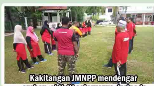
Kakitangan JMNPP mendengar arahan aktiviti seterusnya daripada