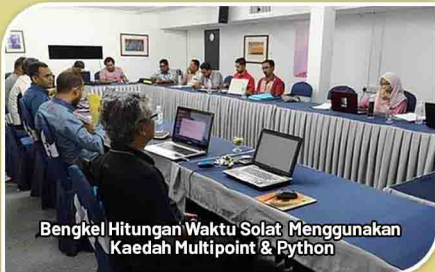
Bengkel Hitungan Waktu Solat Menggunakan Kaedah Multipoint & Python