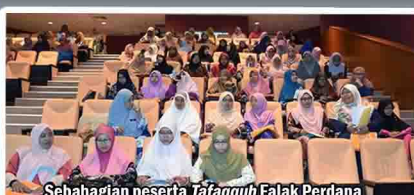
Sebahagian peserta Tafaqquh Falak Perdana