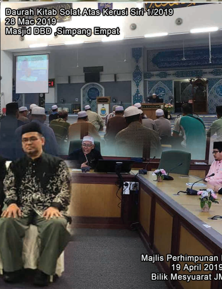
Daurah Kitab Solat Atas Kerusi Siri 1/2019 28 Mac 2019 Masjid DBD, Simpang Empat