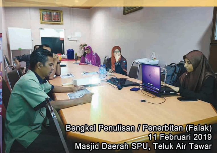
Bengkel Penulisan / Penerbitan (Falak) 11 Februari 2019 Masjid Daerah SPU, Teluk Air Tawar