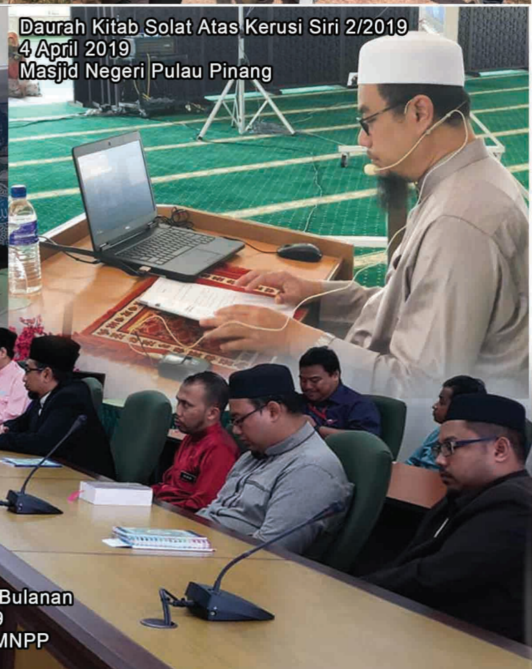
Daurah Kitab Solat Atas Kerusi Siri 2/2019 4 April 2019 Masjid Negeri Pulau Pinang