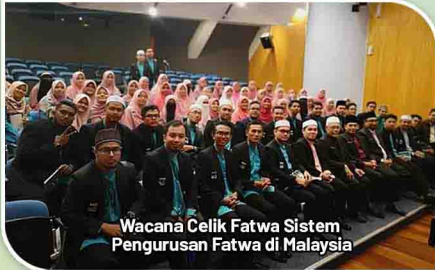
Wacana Celik Fatwa Sistem Pengurusan Fatwa di Malaysia