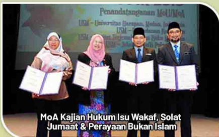
MoA Kajian Hukum Isu Wakaf, Solat Jumaat & Perayaan Bukan Islam