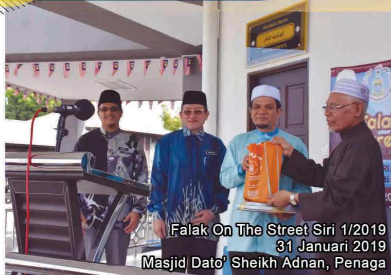
Falak On The Street Siri 1/2019 31 Januari 2019 Masjid Dato' Sheikh Adnan, Penaga