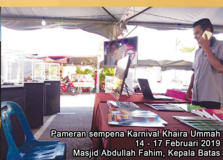
Pameran sempena Karnival Khaira Ummah 14 - 17 Februari 2019 Masjid Abdullah Fahim, Kepala Batas