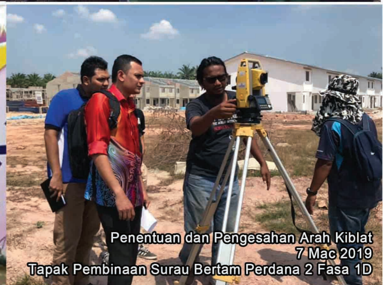
Penentuan dan Pengesahan Arah Kiblat 7 Mac 2019 Tapak Pembinaan Surau Bertam Perdana 2 Fasa 1D