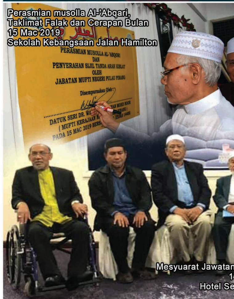
Perasmian musolla Al-'Abqari, Taklimat Falak dan Cerapan Bulan 15 Mac 2019 Sekolah Kebangsaan Jalan Hamilton