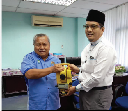
Penyerahan Total Station oleh JUPEM Pahang 22 Januari 2020