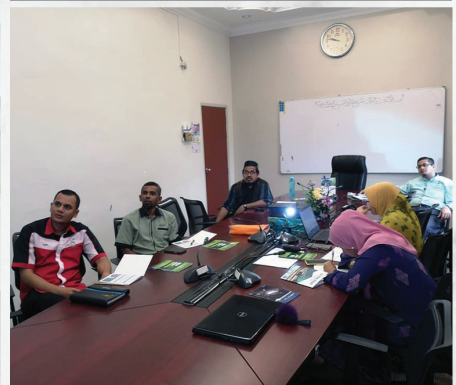
Bengkel Semakan Penerbitan Siri 1/2020 Masjid Daerah Seberang Perai Tengah PERDA, Pulau Pinang 11 Mac 2020