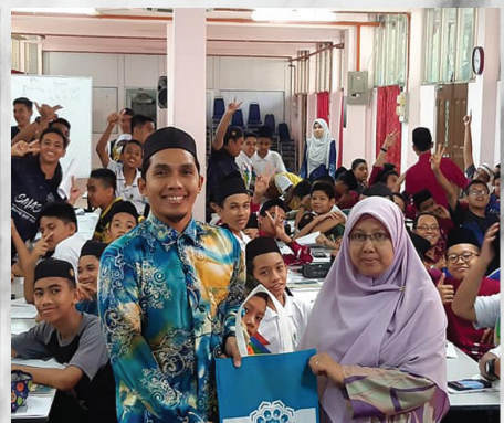
Falak @ School (FAS) Siri 1/2020 SMKA Al-Mashoor (L) Pulau Pinang 27 Februari 2020