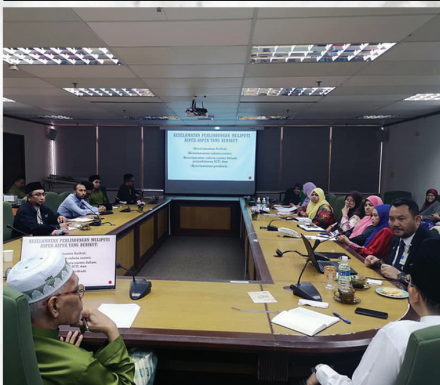
Taklimat Inspektorat Keselamatan Kerajaan Bilik Mesyuarat JMNPP KOMTAR, Pulau Pinang 28 Februari 2020