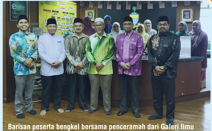
Barisan peserta bengkel bersama penceramah dari Galeri Ilmu