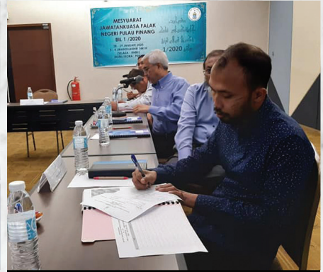
Mesy. JK Falak Negeri Pulau Pinang Bil. 1/2020 Hotel Ixora, Pulau Pinang 28 & 29 Januari 2020