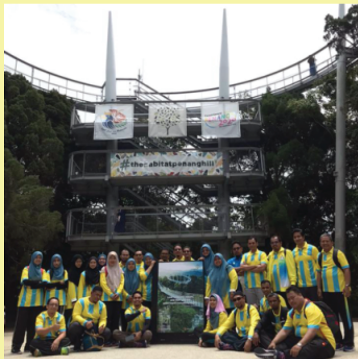
Team Building Jabatan Mufti Negeri Pulau Pinang 7 Mac 2020 The Habitat Penang Hill, Pulau Pinang

Secara keseluruhannya program telah mengeratkan lagi hubungan silaturahim sesama ahli Jabatan. Selain itu juga, ahli JMNPP juga dapat merancang suatu perancangan serta dapat menyumbangkan sesuatu idea kepada jabatan yang bakal dijalankan pada masa akan datang.