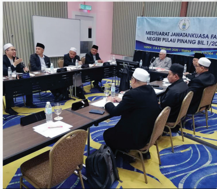
Mesy. JK Fatwa Negeri Pulau Pinang Bil. 1/2020 Hotel Ixora, Pulau Pinang 5 & 6 Februari 2020