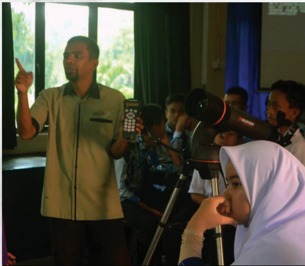
Program Pendidikan Falak Siri 1/2020 : Bengkel Pengendalian Teleskop Maktab Rendah Sains Mara (MRSM PDRM) 30 Januari 2020