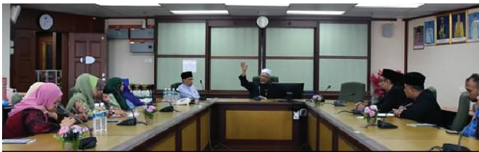
Majlis Penganugerahan Anugerah Perkhidmatan Terpuji bagi Tahun 2018 untuk kakitangan Jabatan Mufti Negeri Pulau Pinang pada 9 Januari 2020.