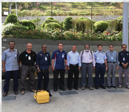
Kajian Waktu Solat Tempat Tinggi Western Hill, Bukit Bendera Pulau Pinang 19 Februari 2020