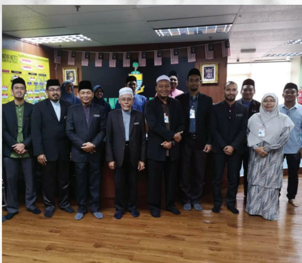
Kunjungan Mahabbah Pengarah Pusat Islam Bilik Mesyuarat JMNPP KOMTAR, Pulau Pinang 18 Februari 2020