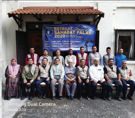
Program Retreat Sahabat Falak JMNPP BumbleDee's Cafe USM Kampus Induk, Pulau Pinang 6 Mac 2020