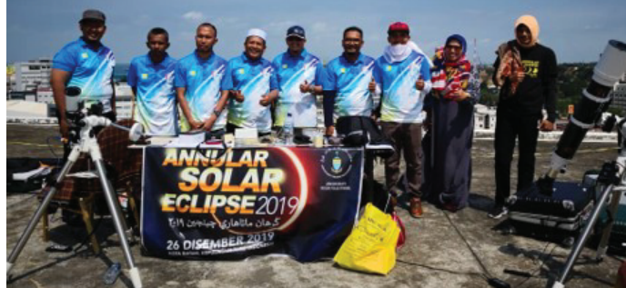
Pasukan Jabatan Mufti Negeri Pulau Pinang di Pacific Palace Hotel

Batam, Indonesia, 26 Disember 2019 - Sekumpulan 10 orang wakil dari Jabatan Mufti Negeri Pulau Pinang (JMNPP) turut berpeluang mencerap fenomena gerhana matahari cincin yang berlangsung pada tarikh tersebut. Pencerapan kali ini menggunakan peralatan khas yang disediakan. Ini merupakan julung kalinya diadakan di Pulau Batam, Riau, Indonesia oleh wakil JMNPP.