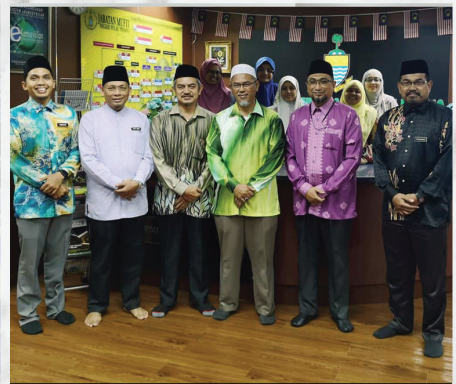
Bengkel Penerbitan Bilik Mesyuarat JMNPP KOMTAR, Pulau Pinang 13 Februari 2020