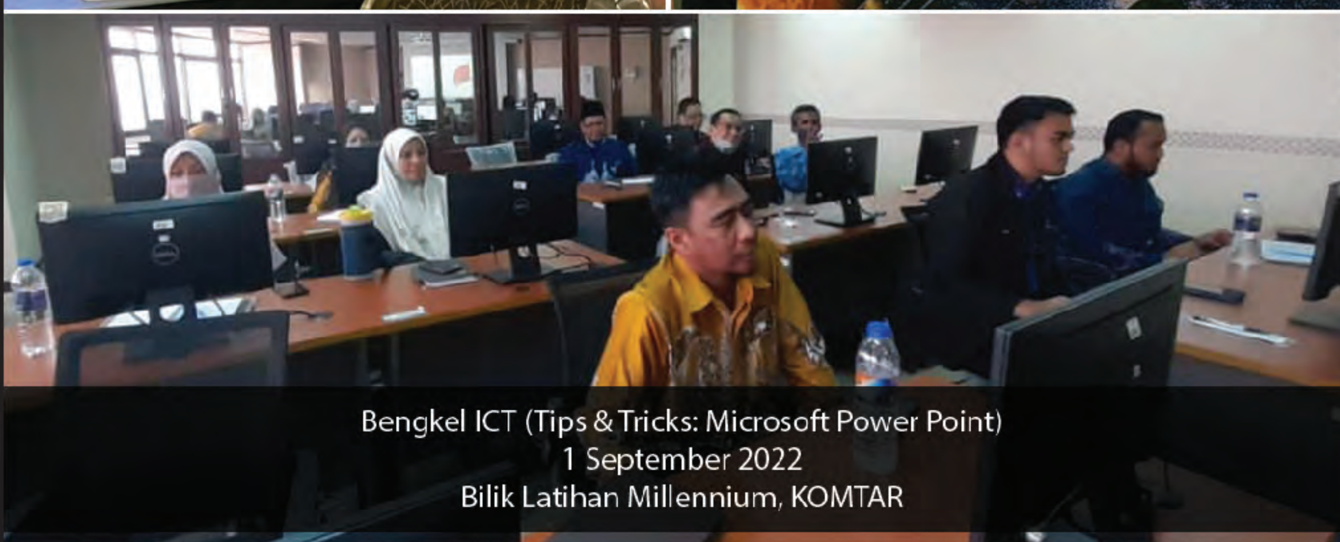
Bengkel ICT (Tips & Tricks: Microsoft Power Point) 1 September 2022 Bilik Latihan Millennium, KOMTAR