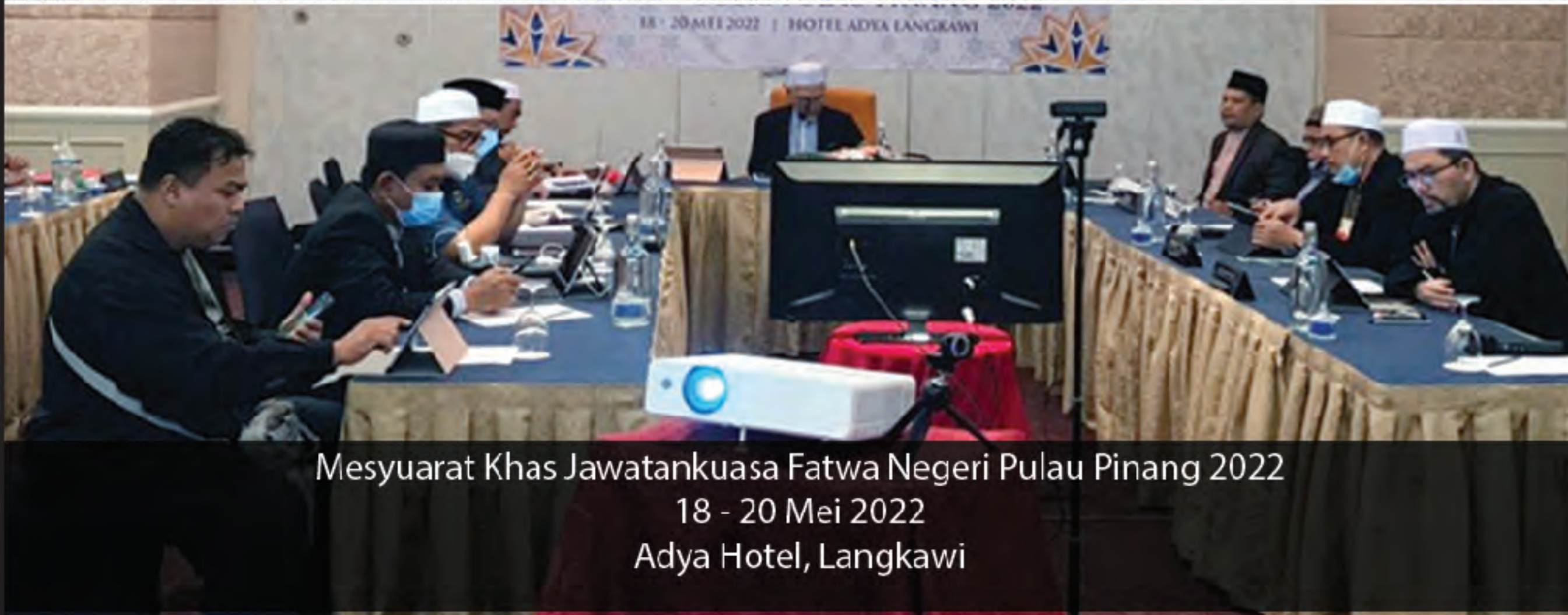
Mesyuarat Khas Jawatankuasa Fatwa Negeri Pulau Pinang 2022 18 - 20 Mei 2022 Adya Hotel, Langkawi