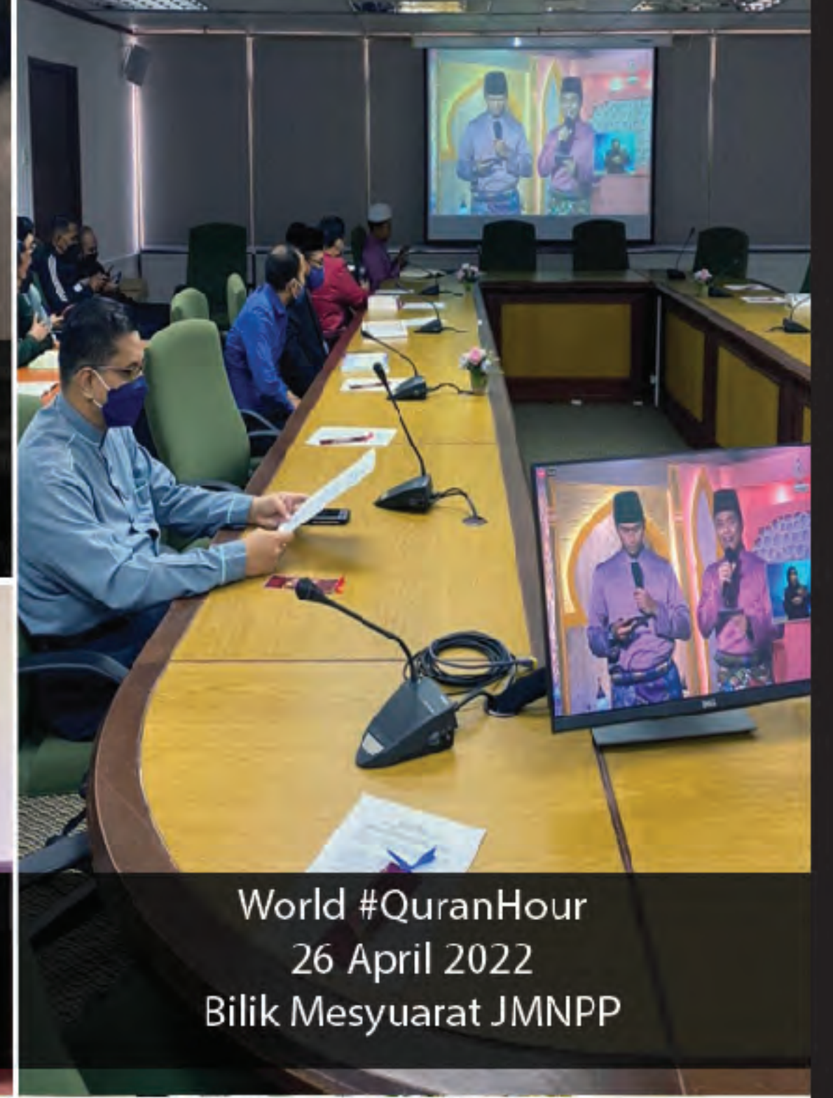
World #QuranHour 26 April 2022 Bilik Mesyuarat JMNPP