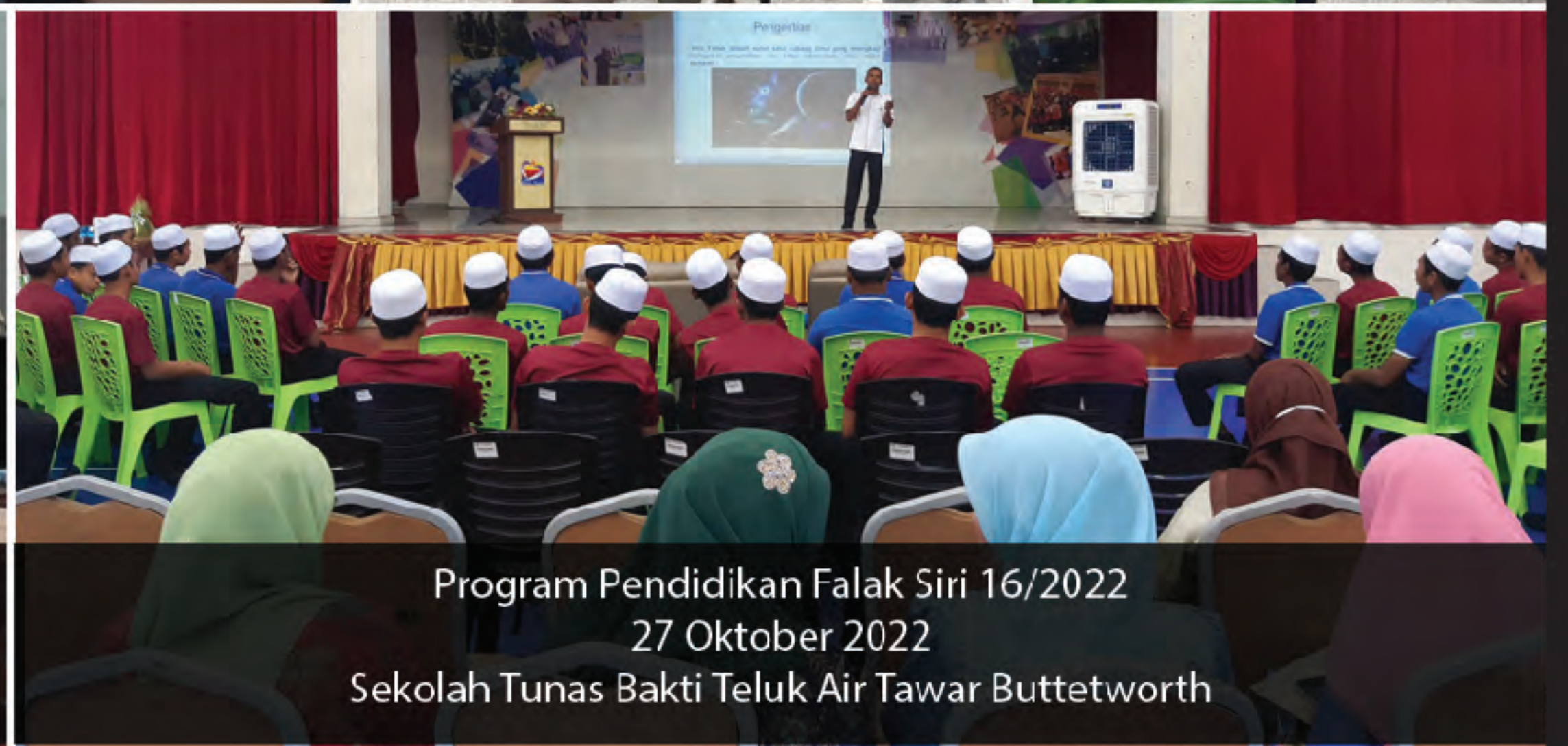
Program Pendidikan Falak Siri 16/2022 27 Oktober 2022 Sekolah Tunas Bakti Teluk Air Tawar Buttetworth