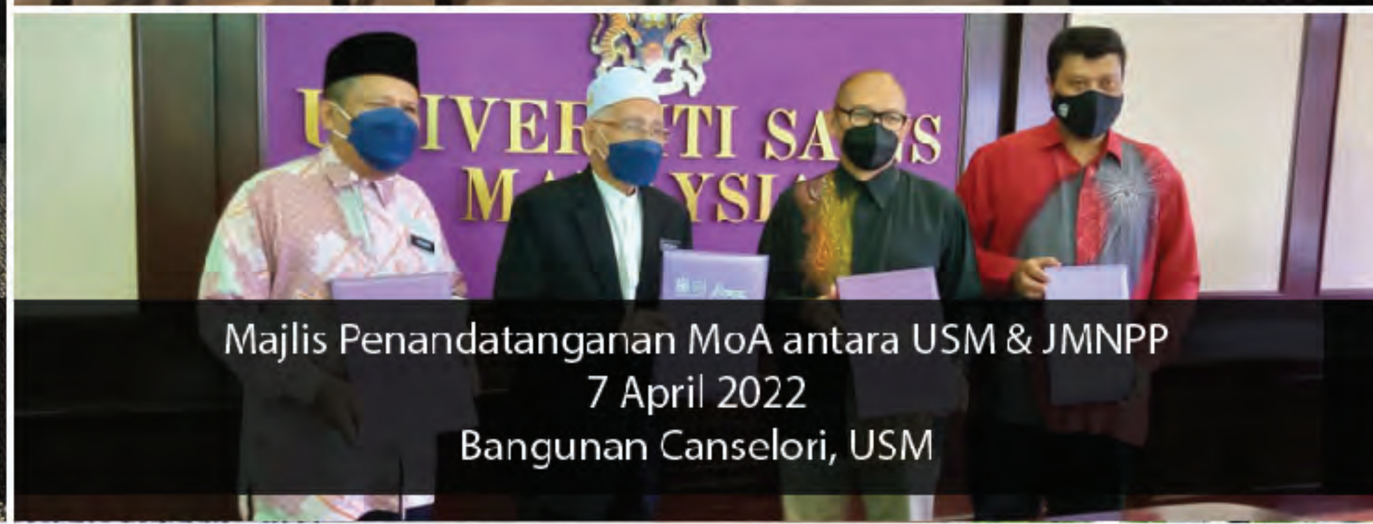
Majlis Penandatanganan MoA antara USM & JMNPP 7 April 2022 Bangunan Canselori, USM