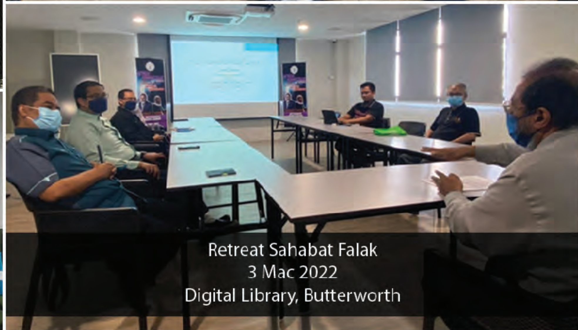
Retreat Sahabat Falak 3 Mac 2022 Digital Library, Butterworth