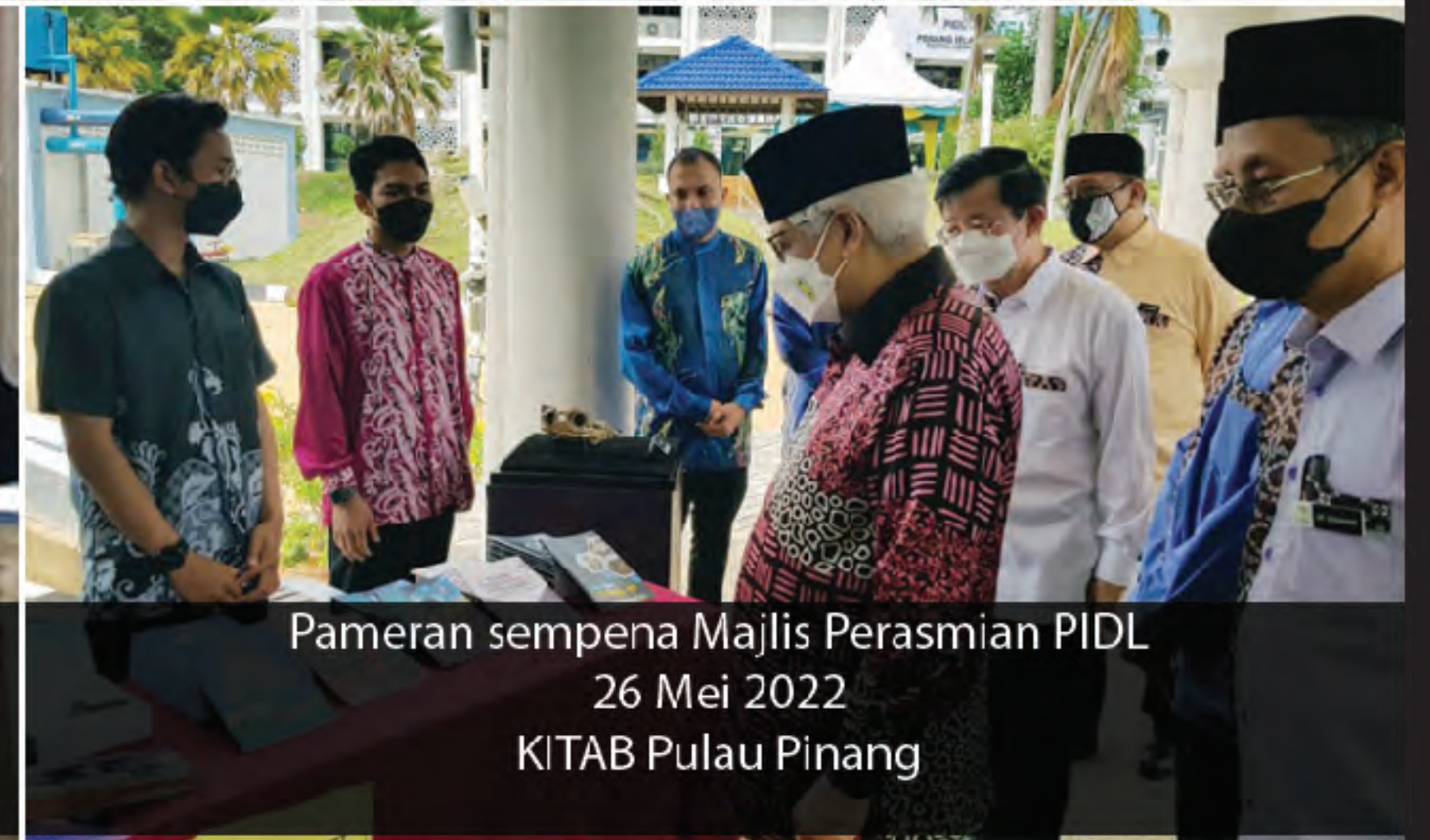
Pameran sempena Majlis Perasmian PIDL 26 Mei 2022 KITAB Pulau Pinang