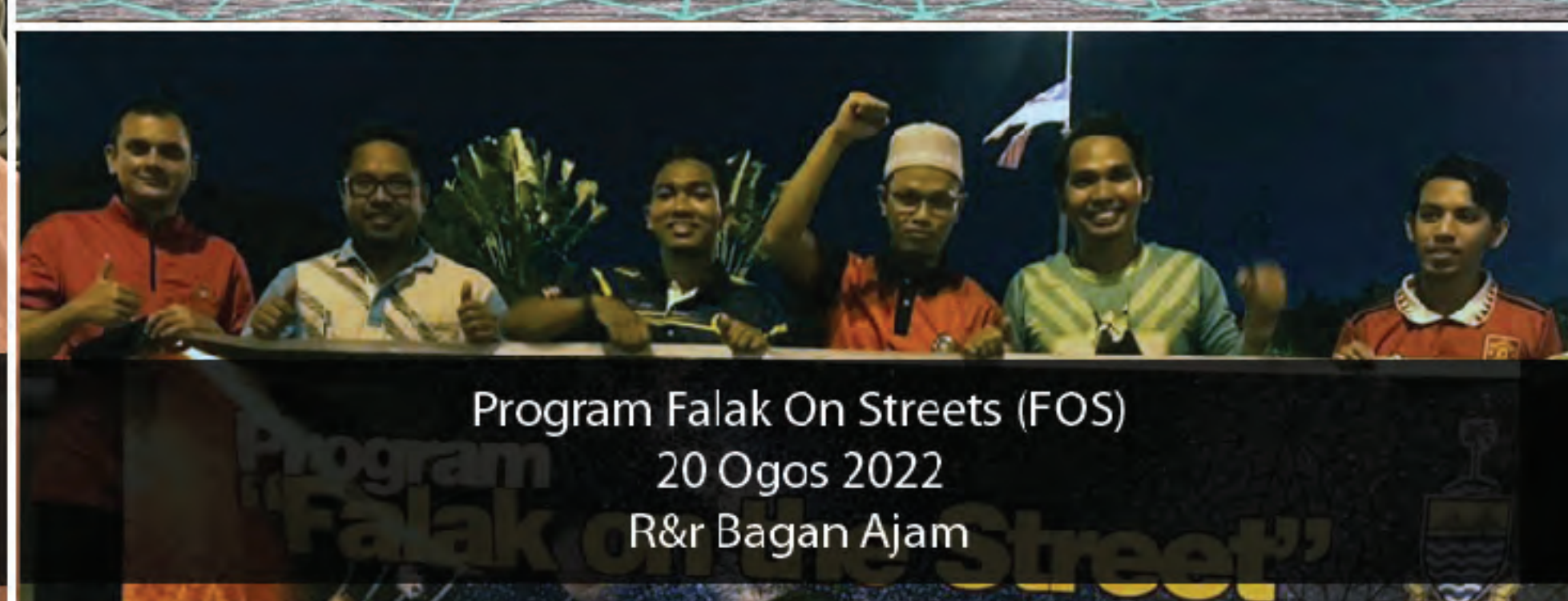
Program Falak On Streets (FOS) 20 Ogos 2022 R&r Bagan Ajam