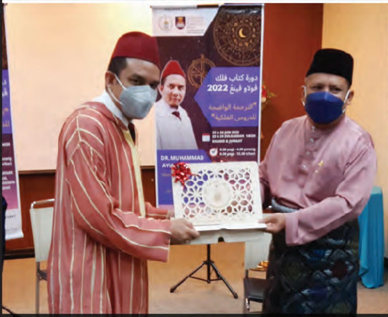
Daurah Kitab Falak Pulau Pinang 2022 24 Jun 2022 Pusat Islam Uitm Permatang Pauh