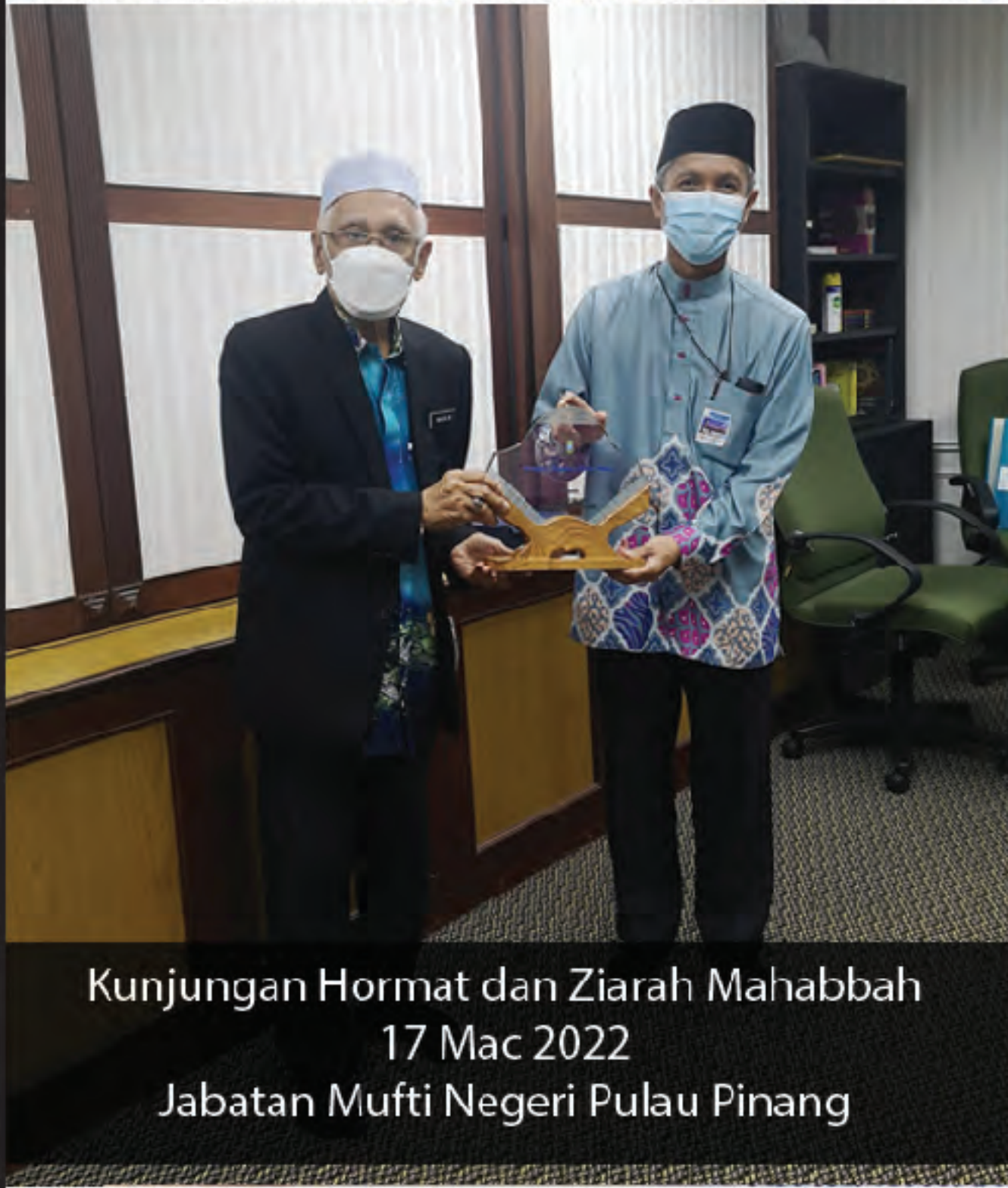
Kunjungan Hormat dan Ziarah Mahabbah 17 Mac 2022 Jabatan Mufti Negeri Pulau Pinang