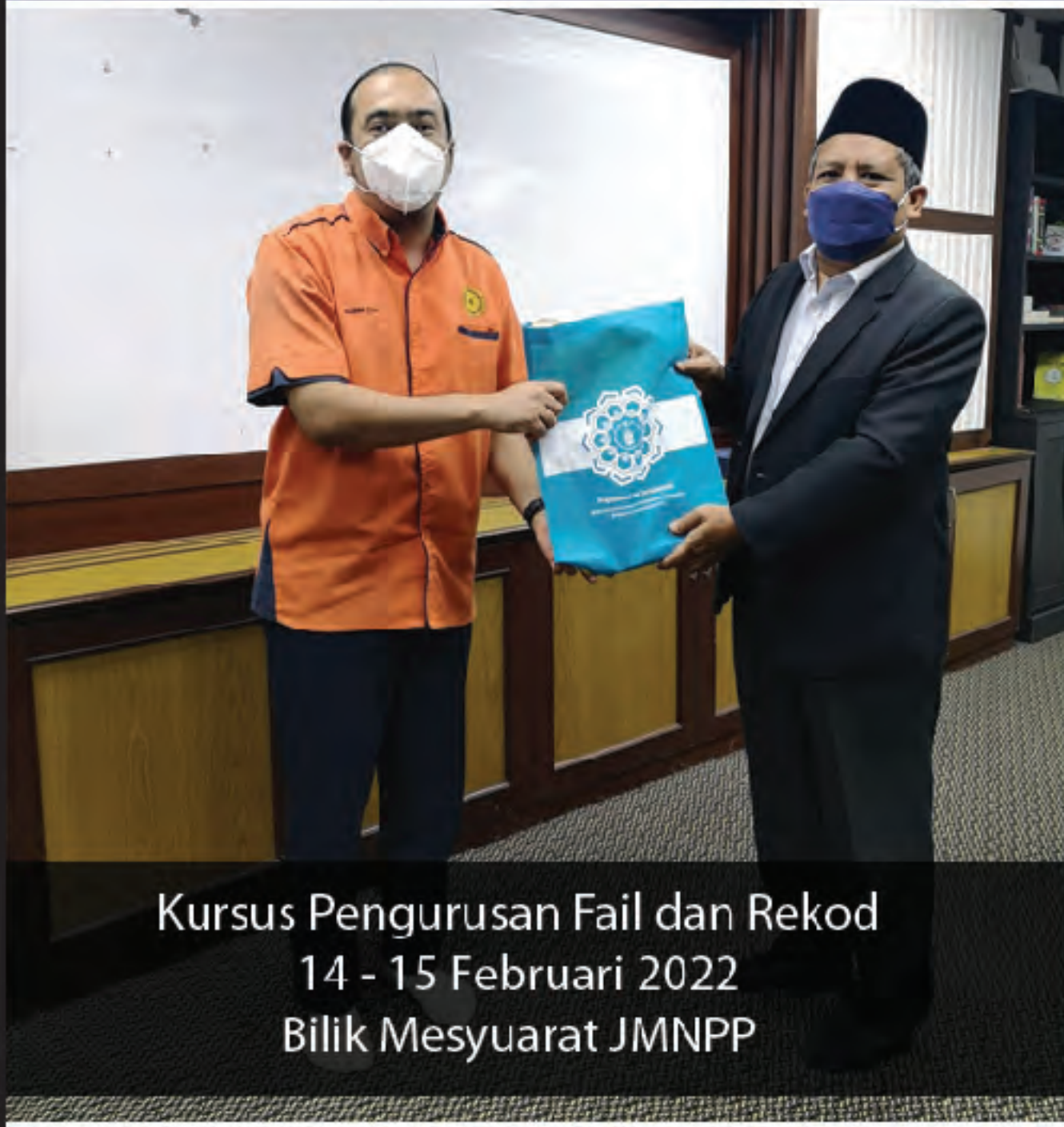
Kursus Pengurusan Fail dan Rekod 14 - 15 Februari 2022 Bilik Mesyuarat JMNPP