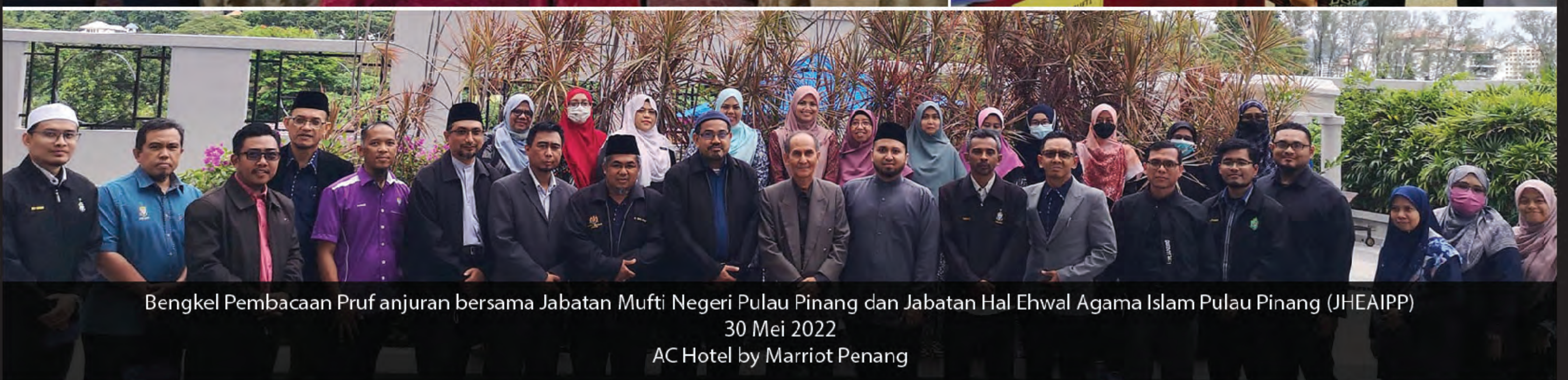
Bengkel Pembacaan Pruf anjuran bersama Jabatan Mufti Negeri Pulau Pinang dan Jabatan Hal Ehwal Agama Islam Pulau Pinang (JHEAIPP) 30 Mei 2022 AC Hotel by Marriot Penang