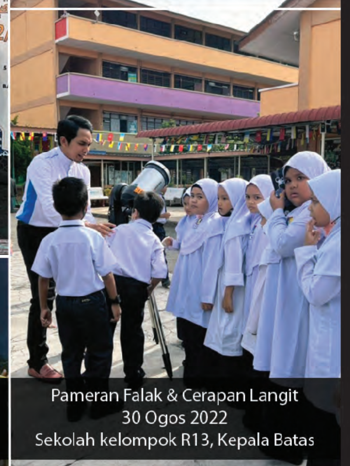
Pameran Falak & Cerapan Langit 30 Ogos 2022 Sekolah kelompok R13, Kepala Batas