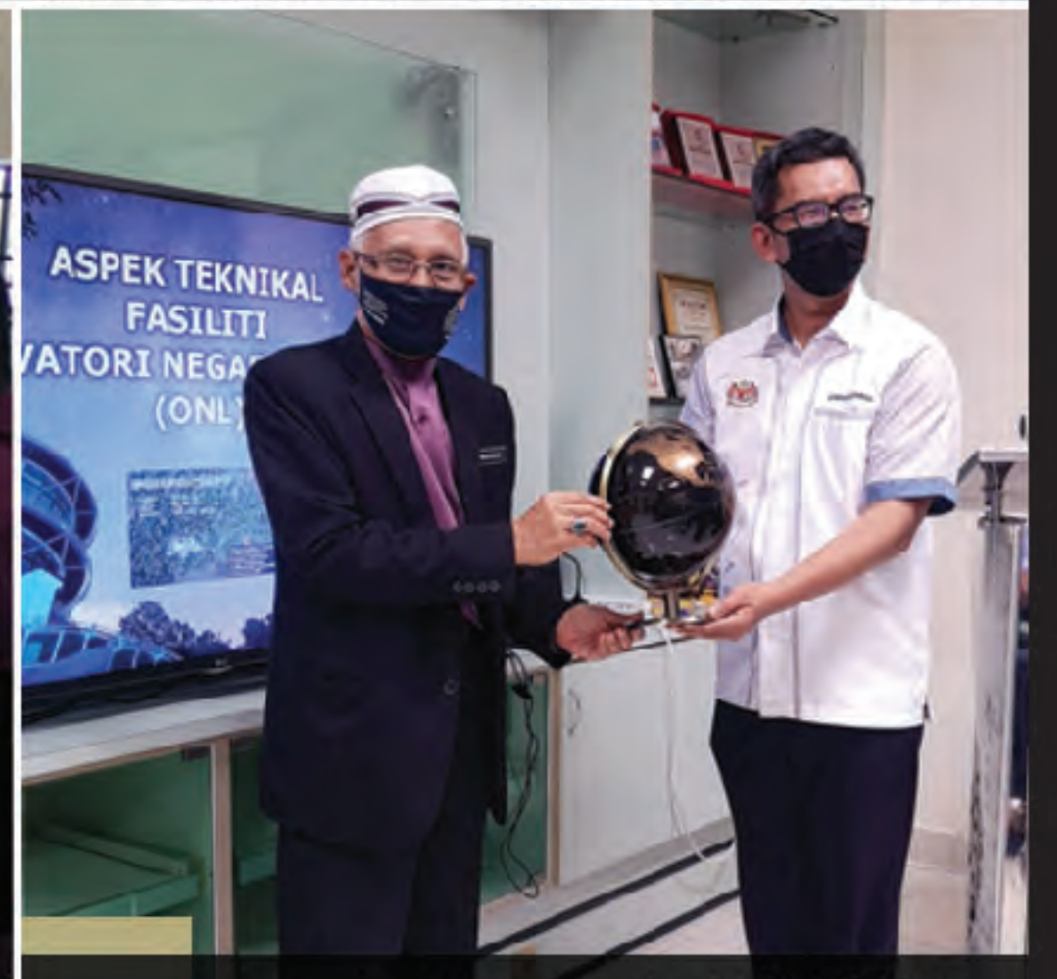
Lawatan Kerja Ahli JFNPP 8 Mac 2022 Observatori Negara Langkawi