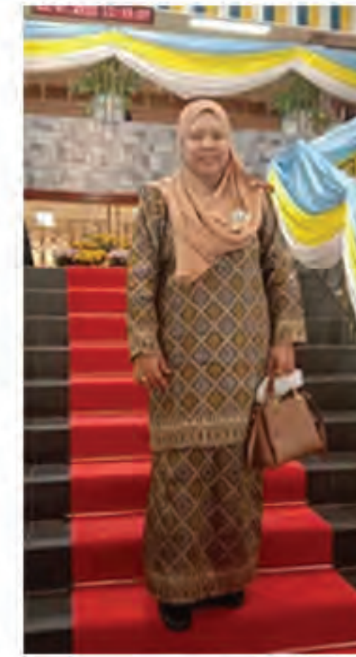
Puan salmi Aida binti Samsimir Pingat Jasa Masyarakat (P.J.M)