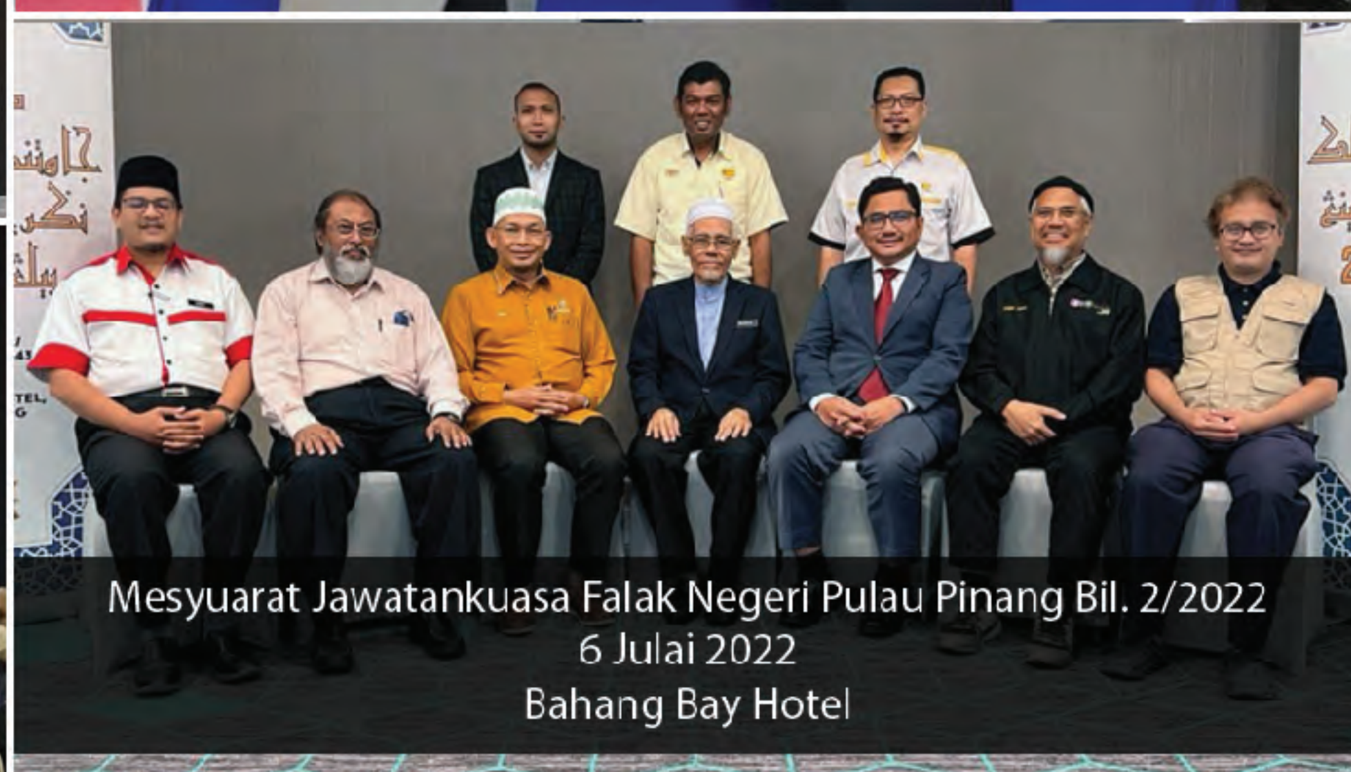
Mesyuarat Jawatankuasa Falak Negeri Pulau Pinang Bil. 2/2022 6 Julai 2022 Bahang Bay Hotel