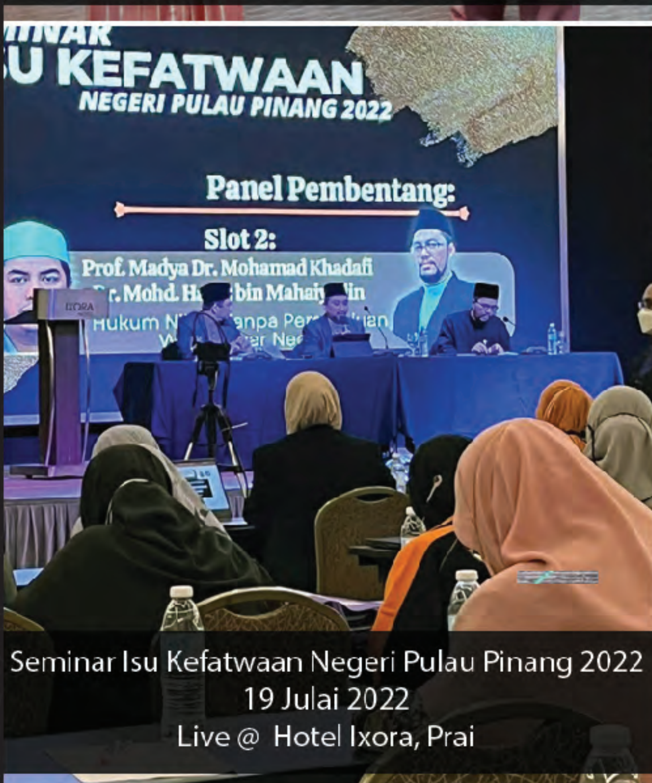
Seminar Isu Kefatwaan Negeri Pulau Pinang 2022 19 Julai 2022 Live @ Hotel Ixora, Prai