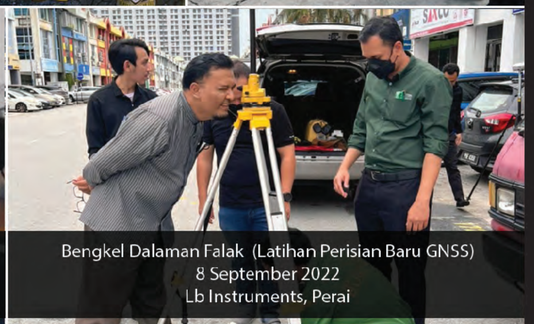
Bengkel Dalaman Falak (Latihan Perisian Baru GNSS) 8 September 2022 Lb Instruments, Perai