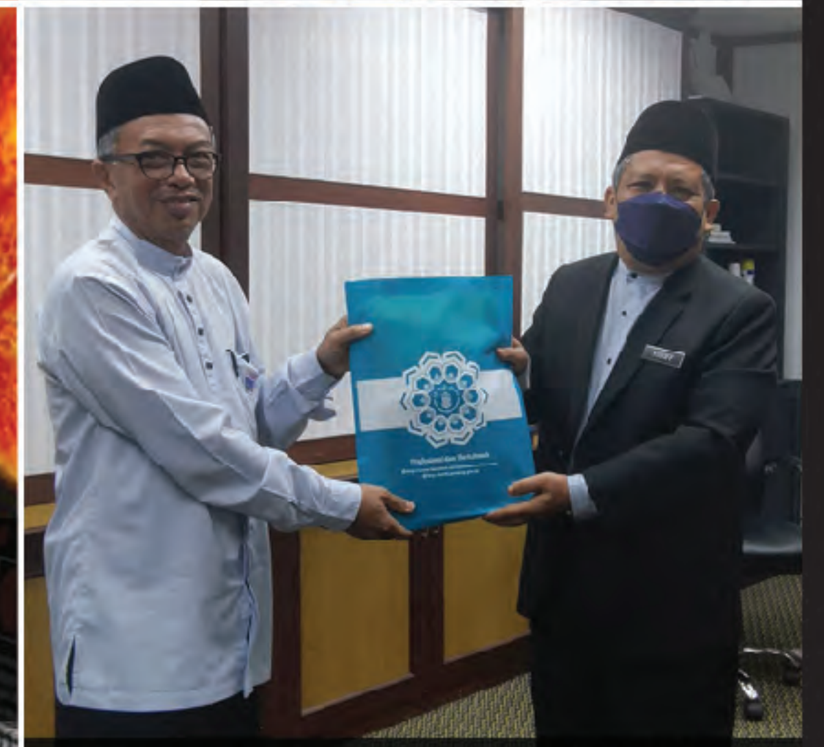
Kunjungan Lawatan Sambil Belajar 25 Julai 2022 Bilik Mesyuraat JMNPP