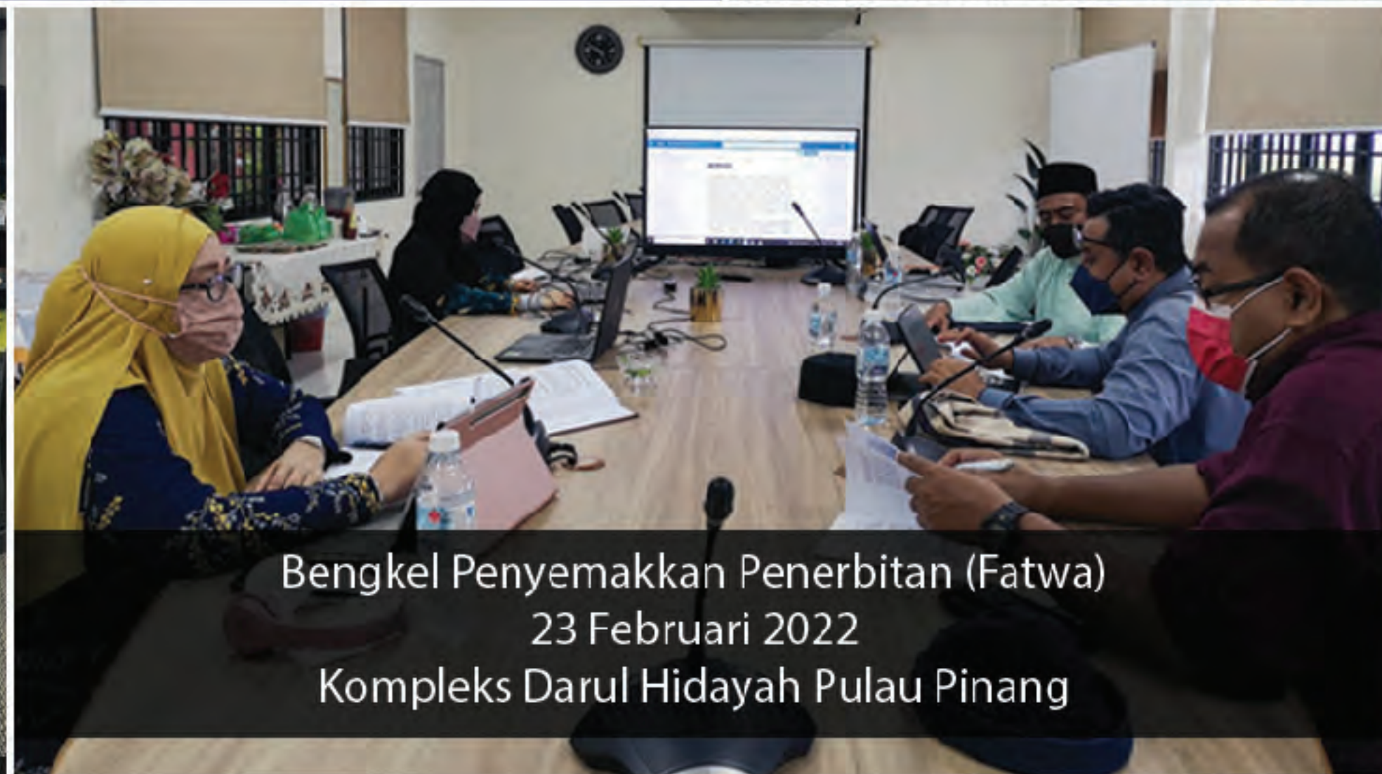
Bengkel Penyemakan Penerbitan (Fatwa) 23 Februari 2022 Kompleks Darul Hidayah Pulau Pinang