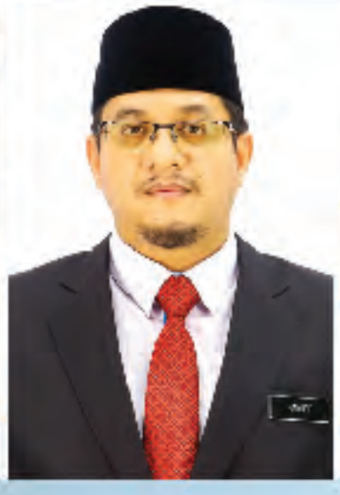
Muhammad Haniff bin Baderun Penolong Mufti Kanan (Falak)