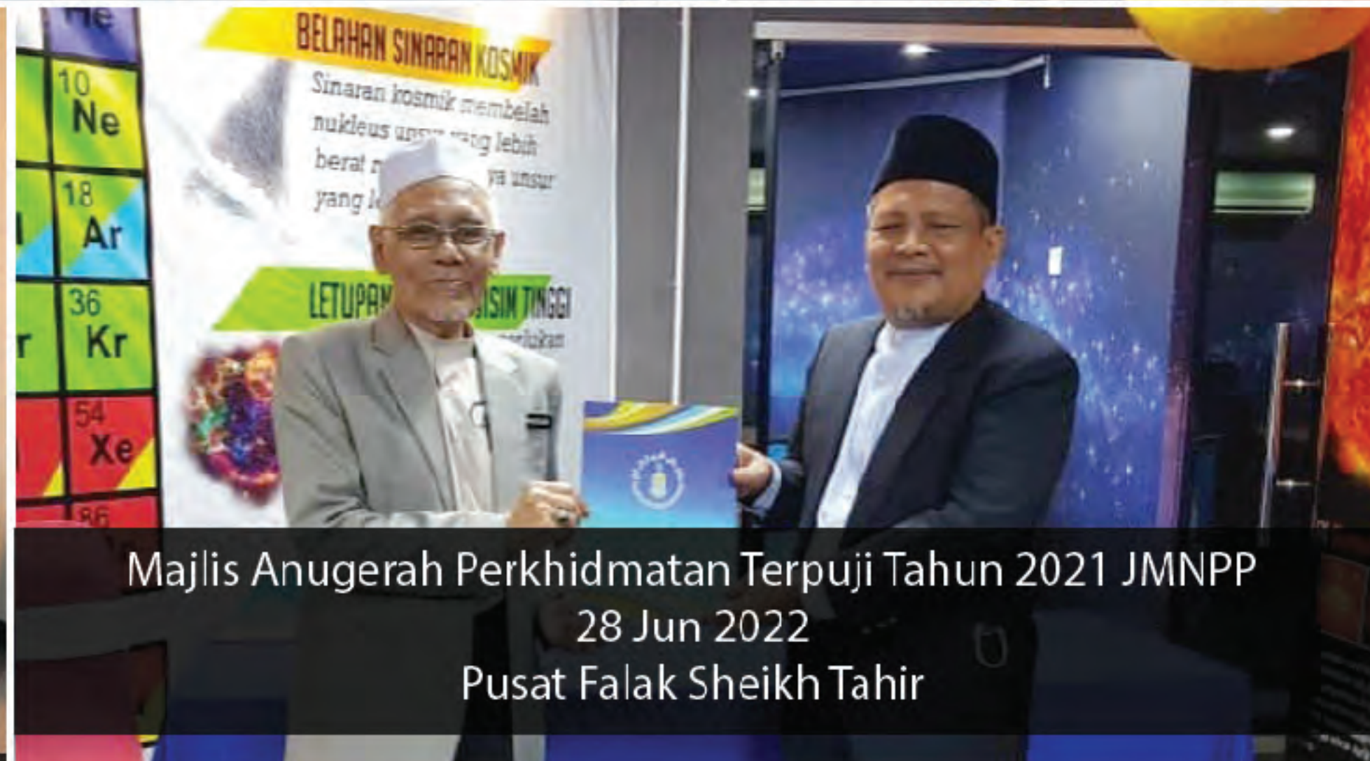
Majlis Anugerah Perkhidmatan Terpuji Tahun 2021 JMNPP 28 Jun 2022 Pusat Falak Sheikh Tahir