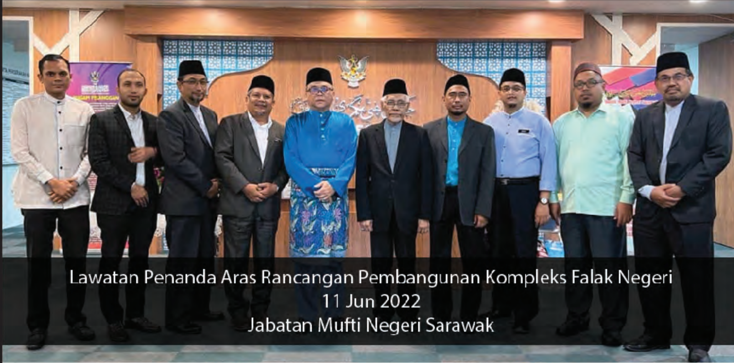
Lawatan Penanda Aras Rancangan Pembangunan Kompleks Falak Negeri 11 Jun 2022 Jabatan Mufti Negeri Sarawak