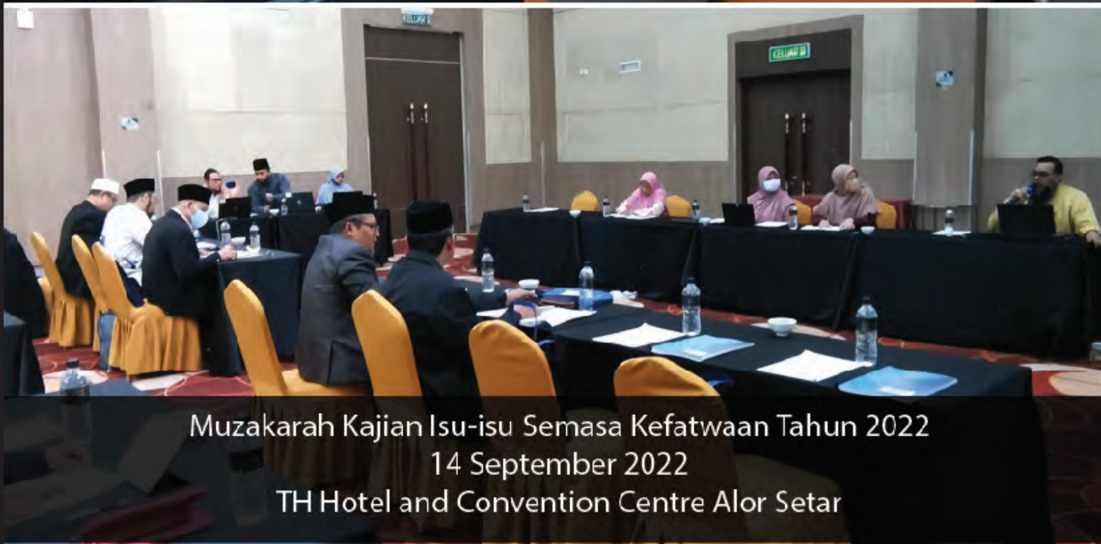
Muzakarah Kajian Isu-isu Semasa Kefatwaan Tahun 2022 14 September 2022 TH Hotel and Convention Centre Alor Setar